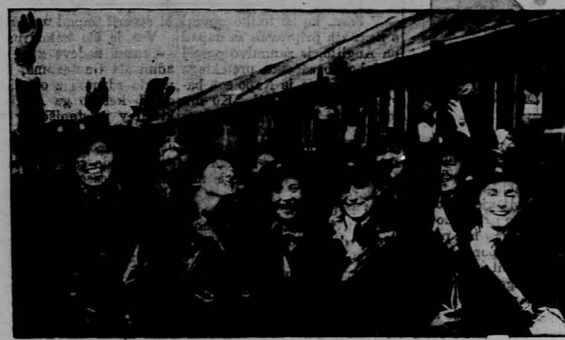
Skupina kanadskih bolničark Rdečega križa, ki so ravno do spele v Anglijo. — Prideljene bodo bolnišnicam, v katerih se zdravijo kanadski vojaki.