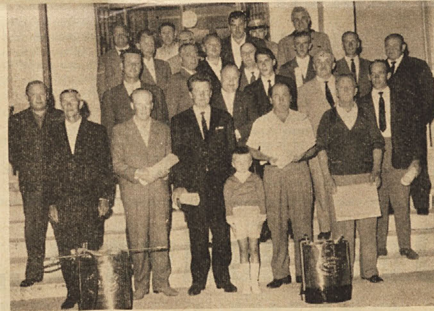
Nagrajeni kmetje iz dolinske občine po razdelitvi nagrad. Med kmeti so tudi predstavniki dolinske občinske uprav; ter drugi povabljenici