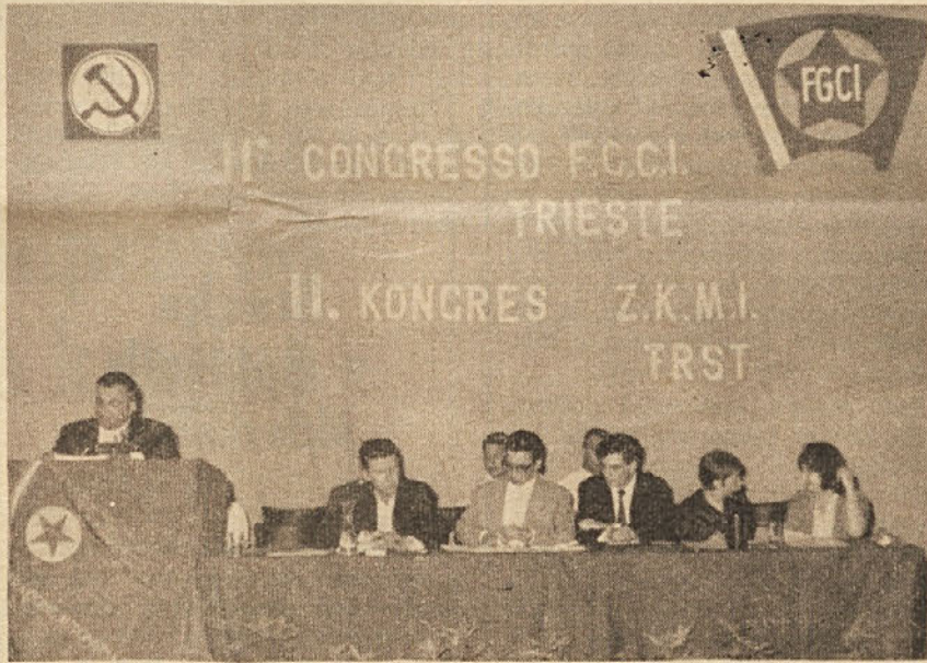
Predsedstvo kongresa Zveze Komunistične mladine