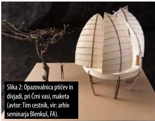
Slika 2: Opazovalnica ptičev in divjadi, pri Črni vasi, maketa (avtor: Tim cestnik).