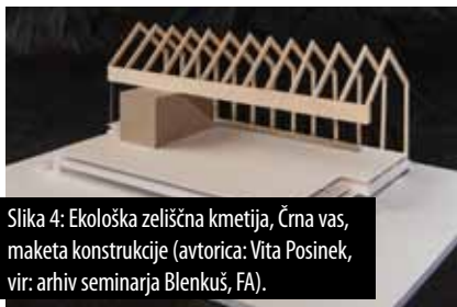
Slika 4: Ekološka zeliščna kmetija, Črna vas, maketa konstrukcije (avtorica: Vita Posinek).