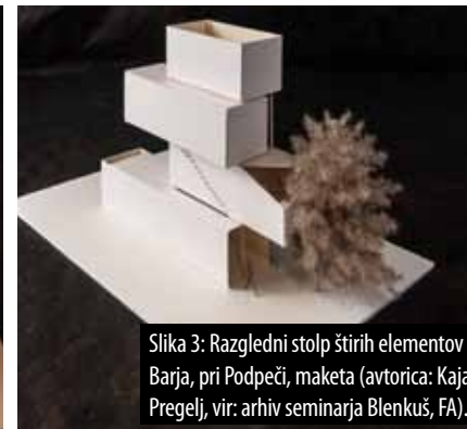
Slika 3: Razgledni stolp štirih elementov Barja, pri Podpeči, maketa (avtorica: Kaja Pregelj, vir: arhiv seminarja Blenkuš, FA).