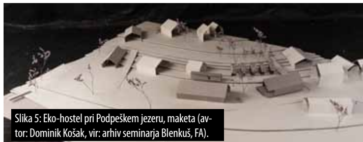
Slika 5: Eko-hostel pri Podpeškem jezeru, maketa (avtor: Dominik Košak).