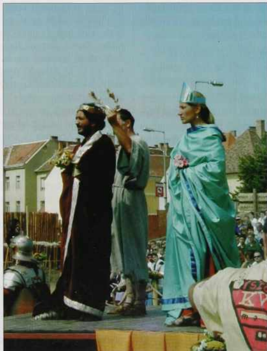
Cezar v Sombotelu, depa tau je nej tisti, šteroga so inda svejta odavali na bližijnjom placi, pa smo ga leko pili, liki rimski cesar.

Gda so prej pred sombotelsko birovijjo meli probo v tej 2 gezaro lejt stari gvantaj, pa so je birauvge zaglednili iz svojoga kancelaja, so uni tó brš telefonérali na občino, če