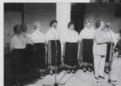
Monoštriske ženske in razstava