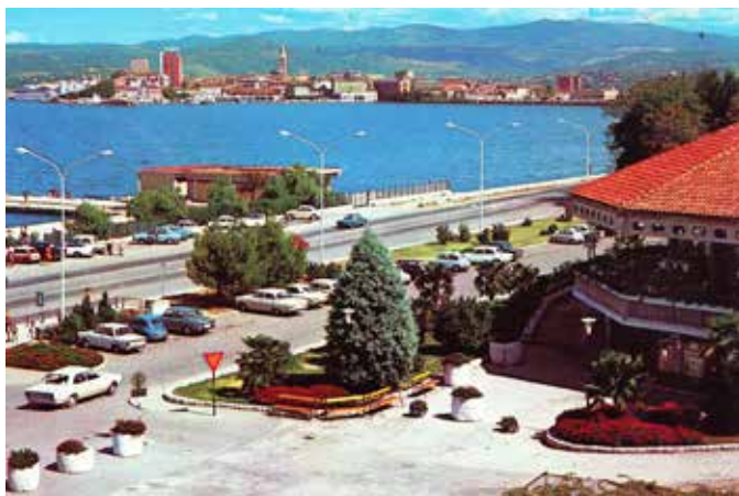
Slika 1: Razgled na Koper z Žusterne