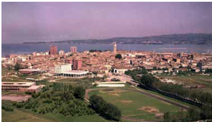
Slika 2: Stolpnici in zvonik: boj za prevlado koprskih višinskih gradenj.

in naprednejšega družbenega reda. K tej hipotezi delno napeljujejo že omenjeni Mihevčevi načrti, da bi obod, sestavljen iz visokih gradenj, nosil simboliko nekdanjega obzidja. Poleg simbolnih vidikov je pomembno poudariti, da je lokaciji novega nebotična botrovala tudi geološka analiza tal, ki je pokazala, da je za gradnjo stavb, višjih od osem nadstropij, v mestnem jedru primeren le prostor, kjer je kasneje nastala soseska Belveder. 7