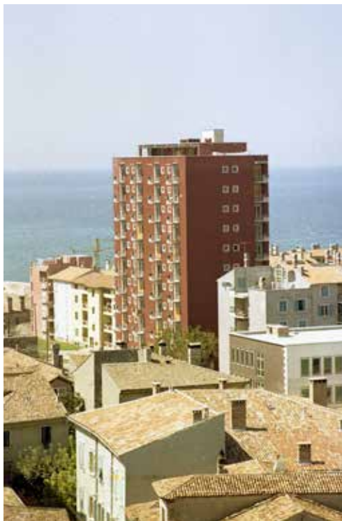
Slika 4: Dominanten položaj stolpnice nad mestnim jedrom

In danes, ko so kot simbol novega časa, kot simbol mesta, ki se je zdramilo iz stoletnega spanja, kot simbol pristanišča, ki nastaja, industrije, ki raste, in se širi, kot simbol ustvarjalnosti našega socialističnega delovnega človeka ob našem morju, zrasli namesto cerkvenih stolpov dve veliki stanovanjski stolpnici, katerima bodo kmalu sledile še druge, nekateri s kar preveč romantične zasanjanosti objokujejo koprsko silhueto. 37