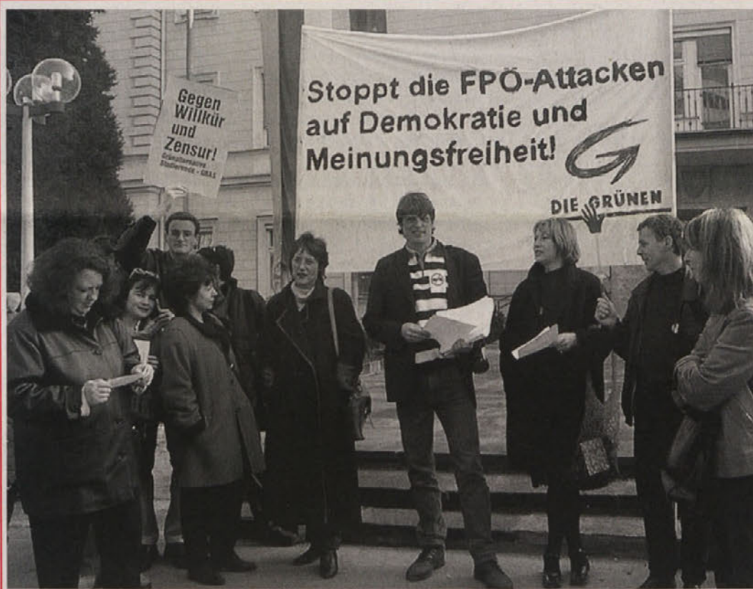
Pred deželno vlado so protestirali proti odpustitvi deželne poverjenice za žene (gl. spodaj)

V deželi pa se polarizacija nadaljuje. Na »udaru« je predvsem ORF, ki da baje ne poroča »objektivno«. Kaj je objektivno, vedo povedati predvsem svobodnjaki. Zato je naslednjo veliko »čistilno« akcijo pričakovati prav pri tem največjem mediju države.