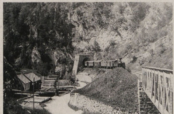
Železniška proga po mostovih in predorih proti Velenju

Razstava je odprta še do konca marca med torkom in petkom med 8. in 18. uro, ob sobotah in nedeljah pa med 9. in 12. uro. a. o.