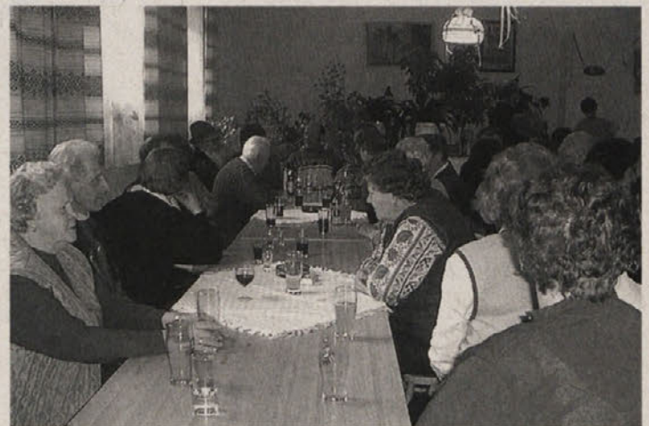
Kočani so se zadržali v prijetnem vzdušju