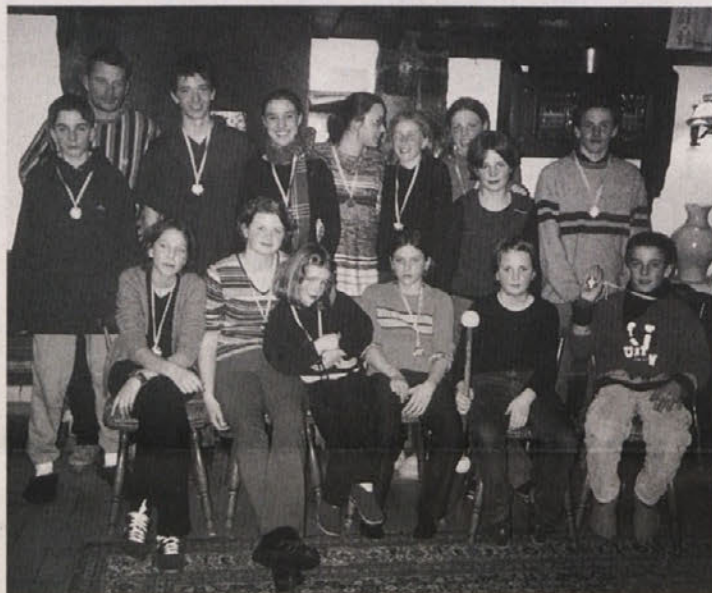
Udeleženci letošnjega smučarskega tečaja SŠZ