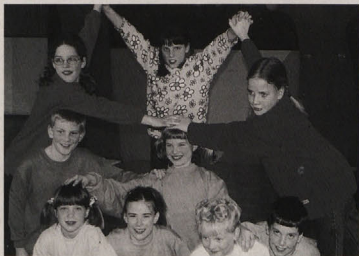
»Navihanci« so pravljico odigrali po najboljših močeh