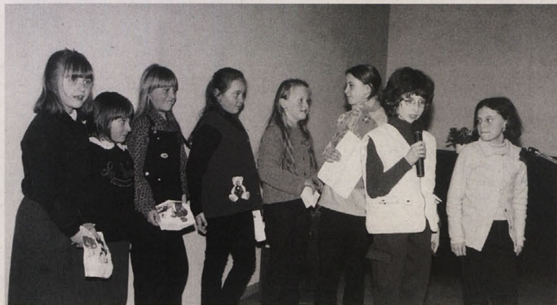
Up in nada sruštva: mladina je recitirala pesmi E. Fritza

In ugotovili, da razdalja sploh ni velika in da bi morala pasti meja tudi v naših glavah. Zato upam, da bo obisk podobnih prireditev z avstrijskega dela Koroške naraščal in da se bo vsaj deloma obnovila zgodovinska povezanost teh krajev z nami. S. W.