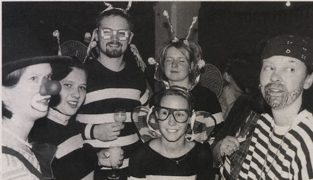
Tudi »čebele« so obiskale pustni ples slovenskega prosvetnega društva »Kočna«