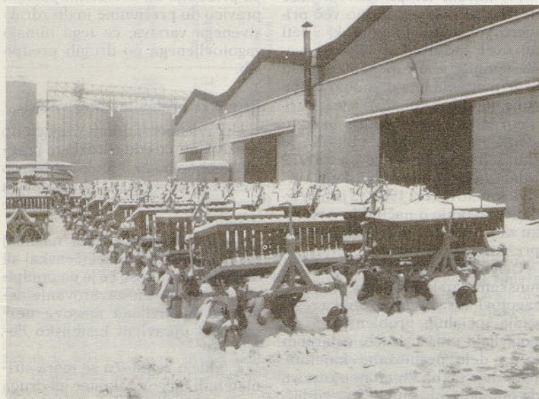
Sadilniki krompirja SK 2 v Strojni Žalec TOZD Proizvodnja kmetijske mehanizacije so že pripravljene za skorajšnjo sezono.

Republiški komite za kmetijstvo, gozdarstvo in prehrano bo skupaj s Splošnim združenjem kmetijstva, živilstva in prehrane Slovenije, Zadružno zvezo Slovenije in Živinorejsko poslovno skupnostjo Slovenije sproti in stalno spremljal izvajanje programa prireje mesa in mleka ter oskrbo z reprodukcijskimi materiali.