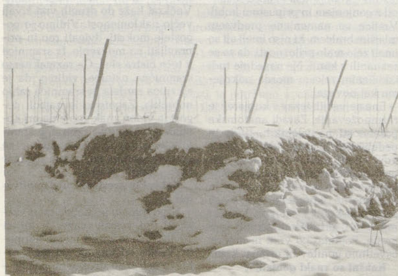
Še je čas, da pripravimo kompost za obnovo hmeljišč.

ljenj kot leta poprej. Predvsem je poostreno določilo, da poklicni vozniki (med te spadajo tudi vozniki traktorjev, ki poklicno opravljajo to delo) ne smejo imeti v krvi nič alkohola. To pomeni, da med upravljanjem traktorja (ali drugega vozila) ne sme imeti voznik nobene alkohola. Ostali vozniki motornih vozil pa ne nad 0,5 promila alkohola. Drugo, zelo strogo določilo velja pri prehitri vožnji skozi naselja, kjer prekračitev dovoljene hitrosti nad 30 km/h pomeni odvzem voz-