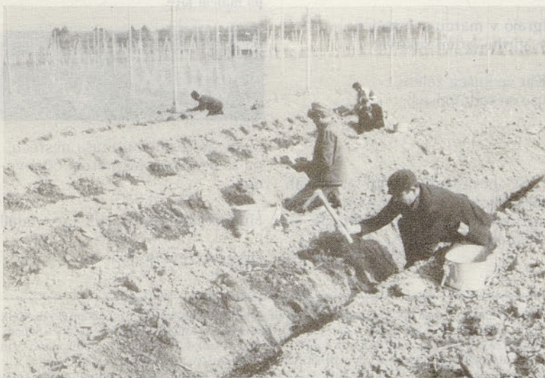
Zgodnje sajenje hmelja da večji pridelek v prvem in tudi v naslednjih letih.

Pri izdaji voznških dovoljenj naj posebej opozorimo vse voznike, ki so stari 55 let ali več. Zakaj?