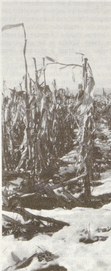
Pospravimo koruznico – koristimo sebi!

Kljub izredno ugodni jeseni in zimi za oranje, se po savinjskih njivah še vedno bohotijo polomljeni ostanki koruznice. Ob vodotokih in gmajnah pa so naloženi kupi hmeljevine – ostanki vrvi hmelja pri obiranju s stroji brez rezalnikov.