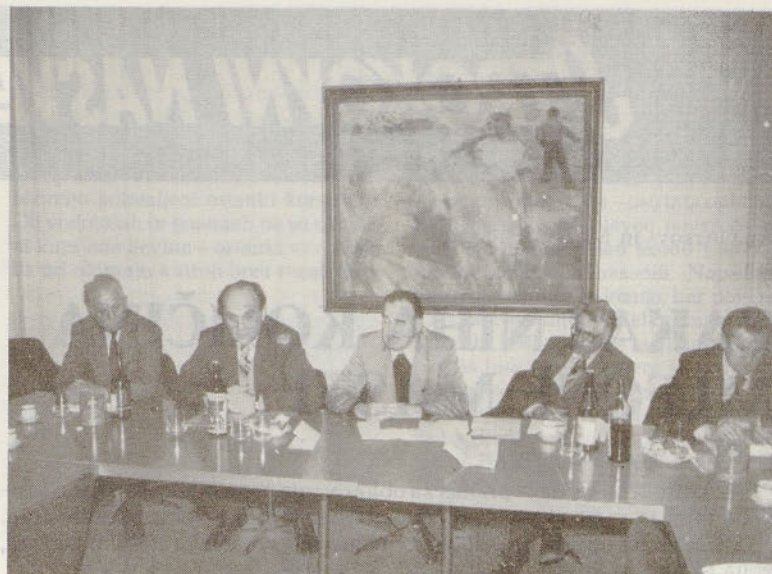
Ob stoletnici združnega hranilništva na tiskovni konferenci na Zadržni zvezi Slovenije v Ljubljani.

Natančnejšo primerjavo pa naj si bralec izdela sam in sicer s pomočjo priloženih preglednic domicilnih in sedežnih stopenj prispevkov iz OD, ki so sestavni del tega članka z onimi, ki smo jih objavili v Hmeljarju marca 1982.