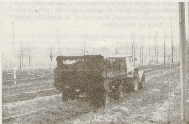
Nikoli ni prepozno. Če nam jeseni ni uspelo pognojiti s hlevskim gnojem, lahko to storimo še zgodaj spomlad!