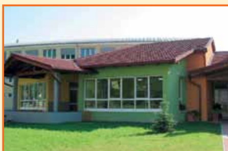
1. mesto v kategoriji najbolj urejen javni objekt v letu 2011 Vrtec Laško, enota Debro