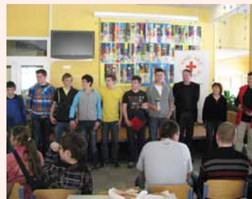
Ekipa tekmovalcev iz Rimskih Toplic se je uvrstila na odlično drugo mesto

Bili smo tudi organizatorji 6. regijskega tekmovanja osnovnošolskih ekip prve pomoči, ki je potekalo v Radečah. Iz območnih tekmovanj so se na regijsko uvrstile štiri ekipe, in sicer: iz OŠ Loče, OŠ Marjana Nemca Radeče, OŠ Štore in OŠ Šmarje pri Jelšah. Šestčlanske ekipe so se prav tako pomerile v zahtevnem teoretičnem znanju s pisanjem testa s področja prve pomoči, cestnoprometnih predpisov in Rdečega križa ter praktičnem reševanju ponesrečencev ob realističnem prikazu poškodb ob treh različnih situacijah, ki se lahko zgodijo v šoli, na poti v šolo ali na šolskem igrišču. Ekipe so pokazale dobro znanje, zato so si za svojo ustvarjalnost, veliko vnemo in prizadevnost na humanem področju prisluzile priznanja