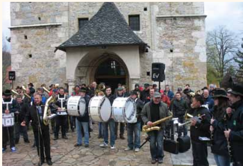
Pohodnike so pozdravili godbeniki iz kar petih godb.