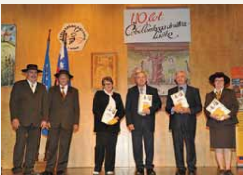
Prejemniki odličja Antona Janše II. stopnje