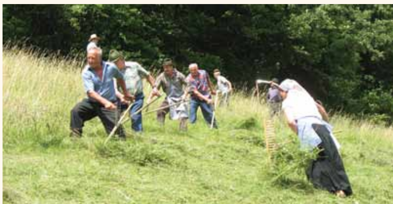
Lani so se nam na košnji v Trobnem Dolu pridružili tudi izkušeni kosci s častiljivimi leti.

Gre za spontano in sproščeno druženje s kosci in grabljicami iz kulturnih društev in skupin ter posamezniki ob čisto pravi košnji in spravilu krme na enem velikih in za delo zahtevnih travnikov v Šentrupertu. Ker v košnji sodeluje izjemno veliko koscev in grabljic, je pogled na družno delo, kakršnega danes vidimo le še malokdaj, res enkratno. Med sodelujočimi bo tudi letos nekaj prekaljenih koscev. Srečanje se bo pričelo v soboto, 7. julija, ob 14.30 uri, pri šoli v Šentrupertu, po opravljenem delu pa se bo zaključilo z druženjem na »likofu« in šegah ob kresnem večeru.