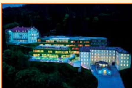
1. mesto v kategoriji najbolj urejeno podjetje v letu 2011 Rimske terme, d.o.o.