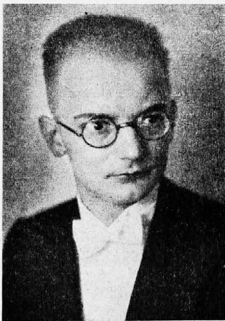
Skladatelj Marijan Kozina

del opere. Srečanje očeta in hčere, ki sledi takoj za tem, nam jasno pokaže nezdrave družinske razmere v Franovi hiši, v katero stopi Amerikanec Niko z delavci, ki žele z njim v tujino. V naslednji sceni je karakteriziran Niko v vsej svoji sebičnosti in pokvarjeno-