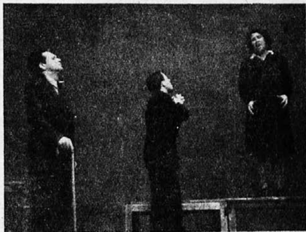
Aranžirka IV. dej.: Korošec — rež. Leskovšek — Karlovčeva

Prišel je čas, ko je končalo tudi to: Rusi in po drugi strani ameriški Liberatorji so končno dopovedali zabitim Nemcem, da