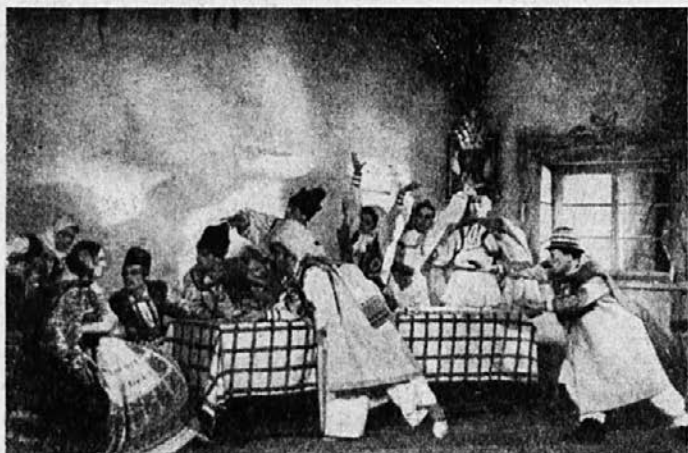
Prizor iz monakovske uprizoritve »Vraga na vasi«