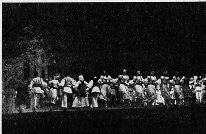
Prizor iz monakovske uprizoritve »Vraga na vasi«