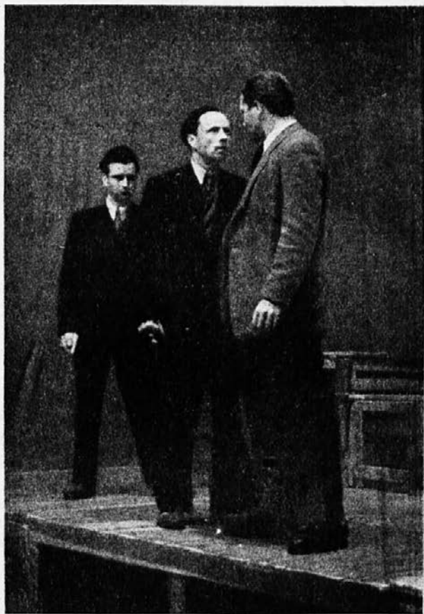
Aranžirka IV. dej.: Smerkolj — rež. Leskovšek — Čuden