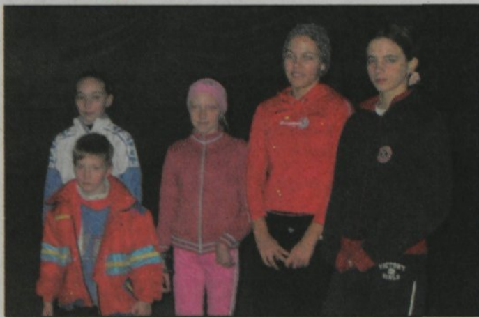
Kotalkarski klub Pirueta