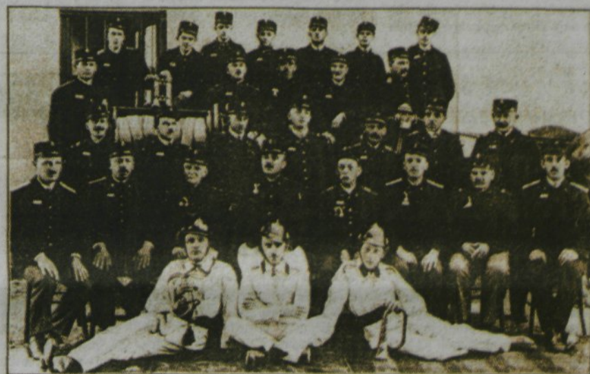
Domžalsko prostovoljno gasilno društvo,

ki je obhajala lani štiridesetletnico svoje ustanovitve (naša slika jo kaže iz leta 1890).