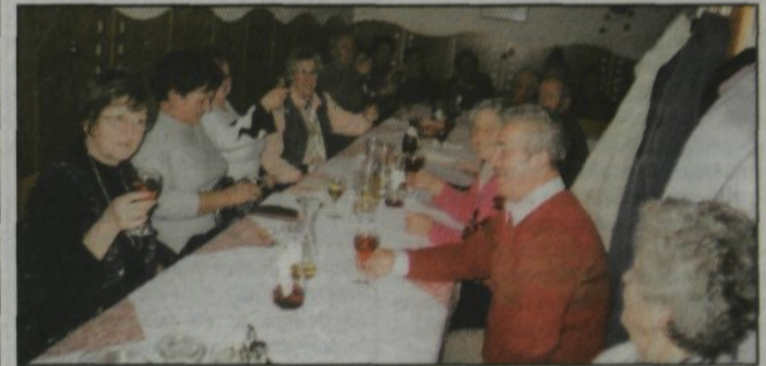
M. Srečanje upokojencev - izletnikov