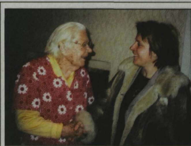
Praznični obiski – drugič