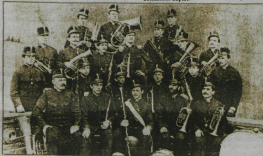
Širom Slovenije znana domžalska godba,

ki je obhajala lani štiridesetletnico svoje ustanovitve (naša slika jo kaže iz leta 1890).