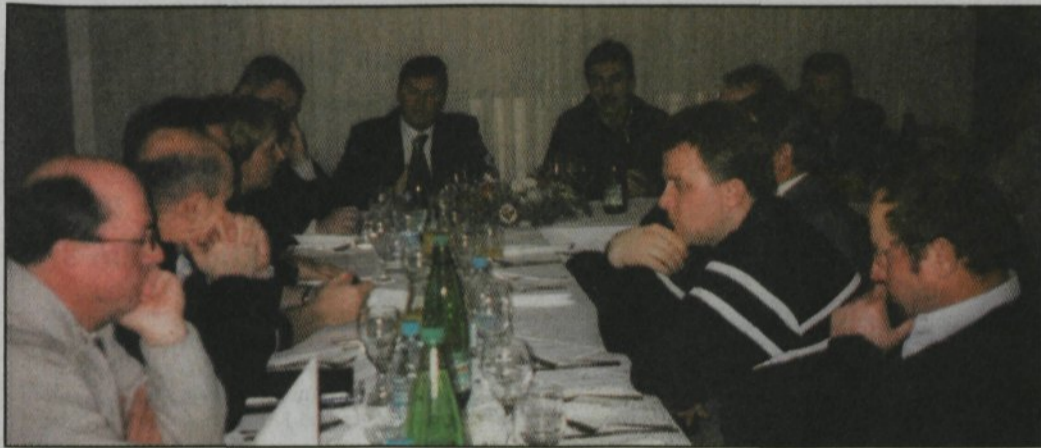
Posvet vodstva Občine Domžale s predsedniki svetov krajevnih skupnosti