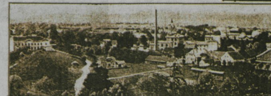
Pogled na trg Domžale.

Slovenski časniki so 9. avgusta 1925 ob seznanitvi svojih bralcev s potekom slavnostnih prireditev v Domžalah, na katere so vabili prebivalstvo kamniškega okraja in mesta Ljubljana, obširno in vsestransko predstavili pomembno vlogo novega trga. Slovenski narod je v uvodniku