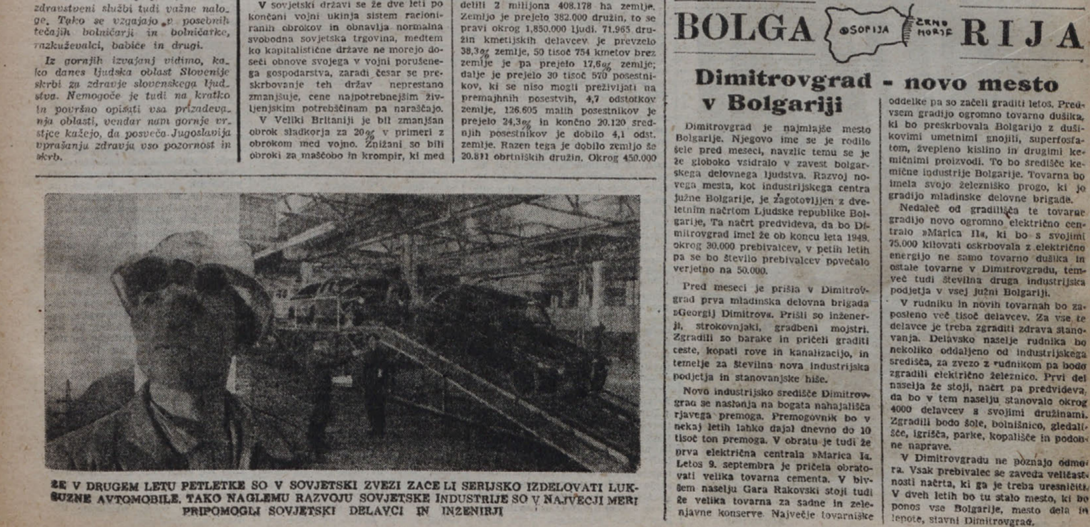
ZE V DRUGEM LETU PETLETKE SO V SOVJETSKI ZVEZI ZACE LI SERJSKO IZDELOVATI LUKSUZNE AVTOMOBILE. TAKO NAGLEMU RAZVOJU SOVJETSKJE INDUSTRIJE SO V NAJVEČJI MERI PRIPOMOGLI SOVJETSKI DELAVCI IN INŽENIRJI

Dimitrograd je najmlajše mesto Bolgarije. Njegovo ime se je rodilo šele pred meseci, navzile temu se je že zloboka vsidravo v zavest bolgarskega delovnega ljudstva. Razvoj novega mesta, kot industrijskega centra v jugovzhodni Bolgarije, je zagotovljen v dveh letih načrtu ljudske republike Bolgarije.