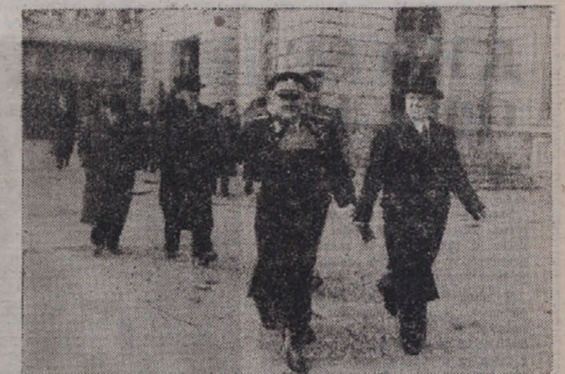
MARŠAL TITO ZAPUSCA V SPREMSTVU PREDSEDNIKA PREZIDIALNE LJUDSKE SKUPŠČINE FL.R.J. DR. IVANA RIBARJA IN ČLANOV VLADE BEOGRADSKO POSTAJO PO POVRATKU IZ BUDIMPESTE.

Vsaka kulturna država se danes zaveda, da sta nje bodočina in razvoj v veliki meri odvisna od zdravja njenega prebivalstva. To da kljub temu pa skrb za ljudsko zdravje ni povsod enaka in zavisi v veliki meri od politične in družbene ureditve države.