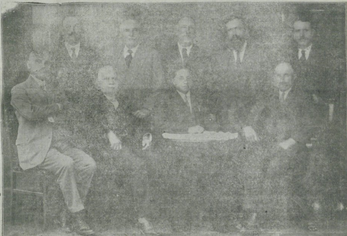
Krajni šolski svet.

Krajni šolski svet je vzel ta predlog v pretres in je sklenil iskati primerno stavbišče v Gaberjah, pa le pod pogojem, da