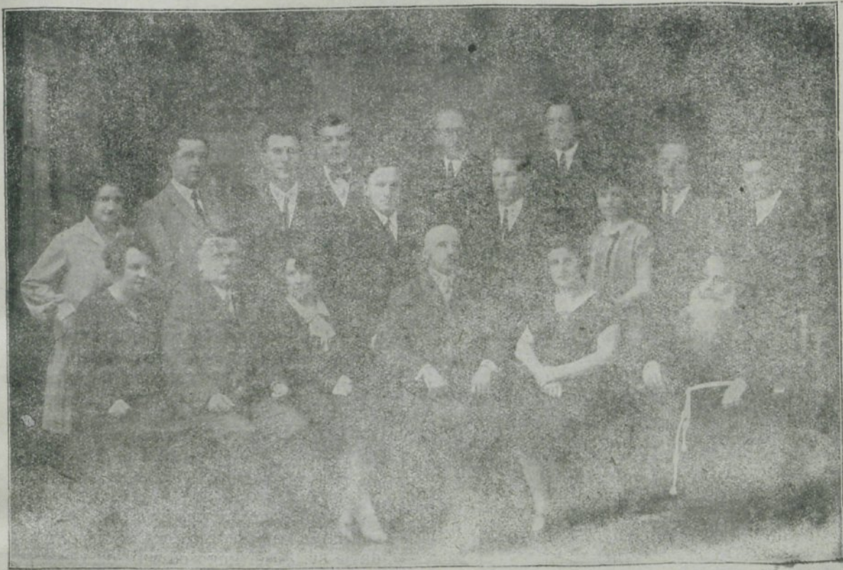
Sedanji učiteljski zbor:

1920. leta je mladina žarečih lichterla pred mestni magistrat, da vidi in pozdravi Njegovo Visočanstvo regenta Aleksandra. Len dan je bil.