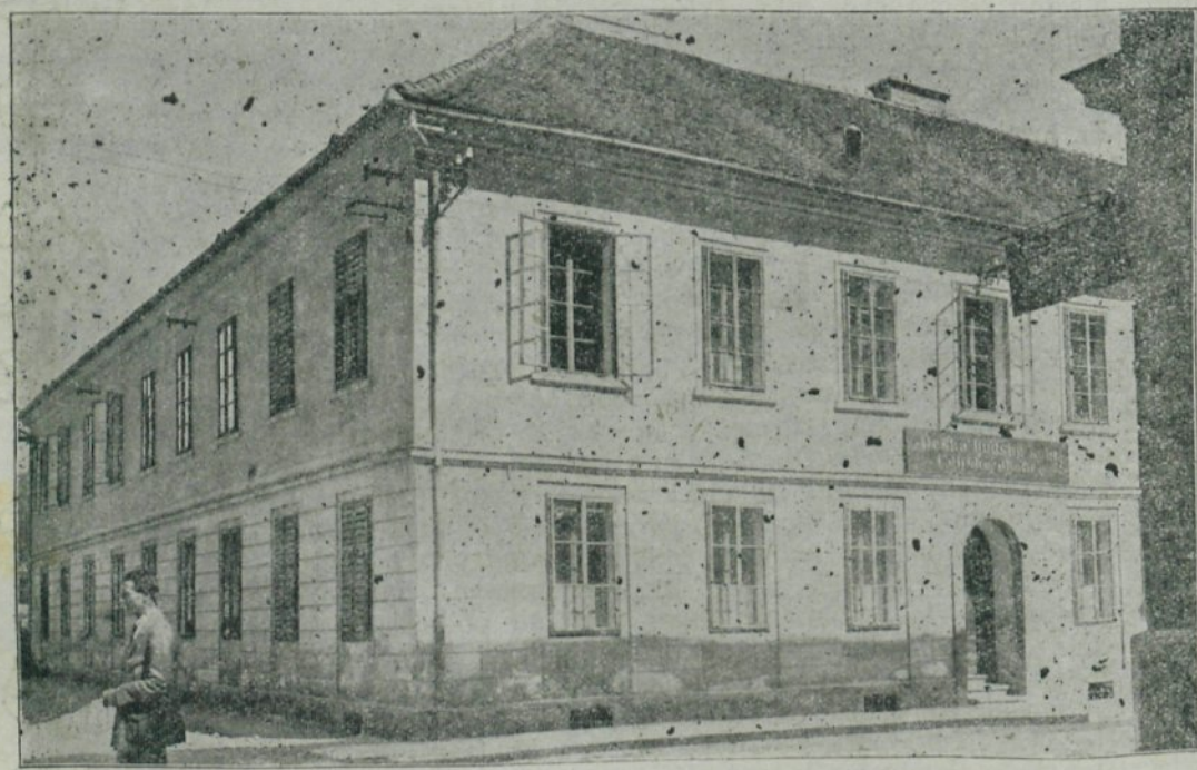
Stara okoliška šola.

Prvi šolski proračun krajnega šolskega sveta je znašal za šolo 797 gld. Zanimivo je tudi, da se je po inicijativi tedanjega učiteljstva ustanovila poljedelska nadaljevalna šola, ki se je otvorila 1. februarja 1876., a se je žal vsled sklepa občinskega odbora v seji 14. januarja 1877. opustila. V jesenskih počitnicah 1876. je kupila občina Okolica-Celje v mestu v tedanji Novi ulici št. 171, sedanji Razlagovi ulici št. 5., do letos obstoječe šolsko poslopje, namreč enonadstropno, privatno stanovanjsko hišo za 14.500 gld. od meščana Tapeinerja in jo adaptirala za šolsko uporabo. S šolskim letom 1878/79 je pa ustanovila kongregacija šolskih sester iz Maribora v Okolici-Celje privatno dekliško šolo. Od tedaj obiskujejo to šolo deklice iz okolice.