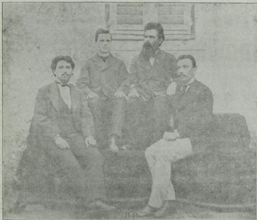
Prvi učiteljski zbor.

zgradbe novega šolskega poslopja, ali občinski zastop mesta Celja ni hotel o tem ničesar slišati in vedeti ter je odobril le obljubo županovo glede sfarih klopi. Krajni šolski svet je vsled tega zaprosil šolske oblasti, naj se šolsko vprašanje sistira do zgradbe novega šolskega poslopja. Po dolgem prizadevanju se je končno posrečilo krajnemu šolskemu svetu pridobiti eno sobo v Kodermanovi hiši v Gosposki ulici št. 19., kjer je bila prej mestna dekliška šola, proti mesečni najemnini 12 gld. Druga soba se je dobila v nekdanjem mestnem bolniškem posloppju za 10 gld. mesečne najemnine. Tretja učna soba je pa bila v drugem nadstropju občinske hiše. Tako je bila pot odprta, da se je otvorila šola; s poukom se je začelo 20. IX. 1875.