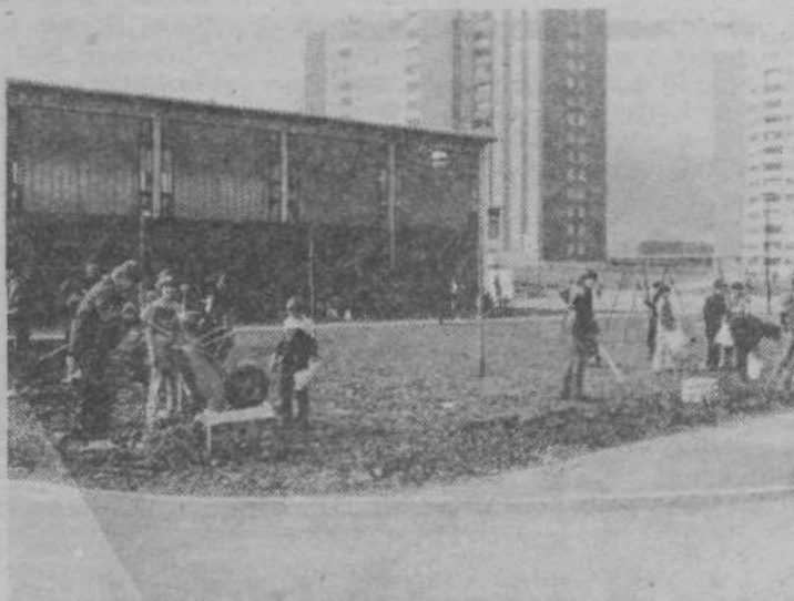
Očiščevalne akcije imajo poleg praktičnih tudi več vzgojnih momentov. Na posnetku ena od takih akcij mladih pred OŠ Karla Destovnika-Kajuha v Nussdorferjevi ulici.