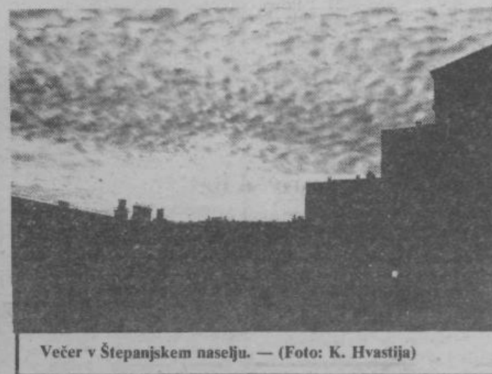
Večer v Štepanjskem naselju.