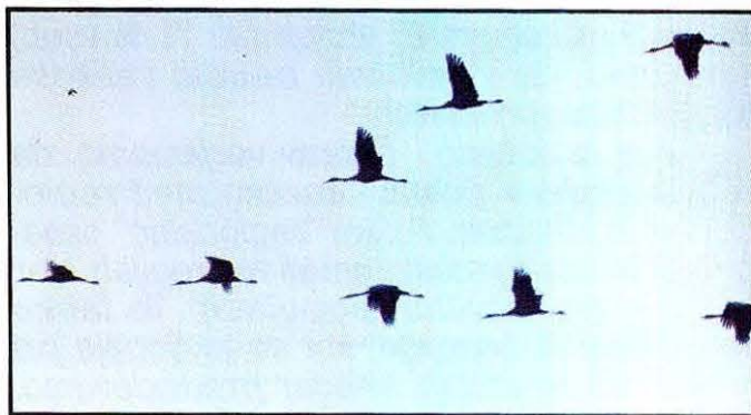
Grus grus , 6.3.1995, Šenčur