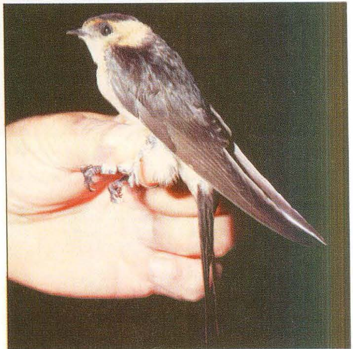
Hirundo daurica , 24.8.1993, Vrhnika

Dendrocopos major , 9.1.1993, Prekopa, svatovanje samec + samica, NK; Dendrocopos medius , 15.3.1993, Cigonca, 2 pojeta, FB; 8. in 11.4.1993, Žužemberk, 1 samec, BM&DŠ; 19.7.1993, Sp.Ščavnica, 1 os., FB; 4.7.1993, Modraže, 1 os., AV; 31.10.1993, Šoštanjko jezero, 1 os., DV; Dryocopus martius , 1.1.1993, Kocjančiči, 1 os., IC; 12.7.1993, Stražun pri Mariboru, 1 os., FB; Jynx torquilla , A, 3.4.1993, Godovič, 1 ujeta, PG; A, 4.4.1993, Bizovik, 1 ujeta, JB; D, 20.9.1993, Jarški prod, 1 ujeta, MB; Delichon urbica , A, 16.3.1993, Izola, 7 os., BR; A, 23.3.1993, Podgozd/Krka, 1 os. (-3C), DŠ&BM; D, 24.10.1993, Bled, 1 os., BK; Hirundo rustica , A, 22.3.1993, Rače, 1 os., MV; A, 23.3.1993, Podgozd/Krka (-3C), 6 os., DŠ&BM; 2.4.1993, Rače, 2 os.-ad., MV; A, 27.3.1993, Komarnik, okoli 10 os., FJ; D, 16.10.1993, Galjevica/Lj., 1 os., DŠ; Hirundo daurica , 24.8.1993, 1 ujeta, Vrhnika, BL;