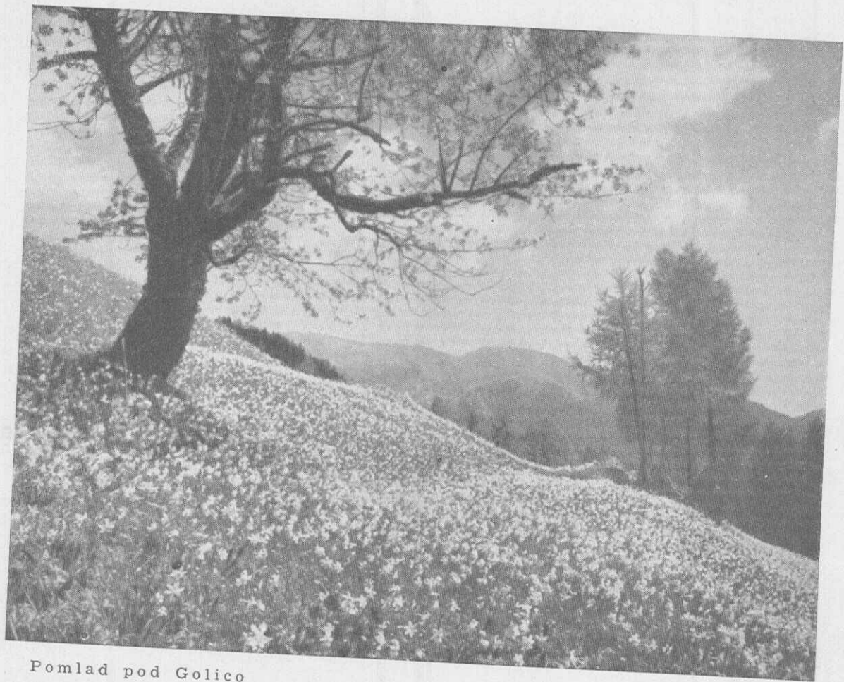
Pomlad pod Golico