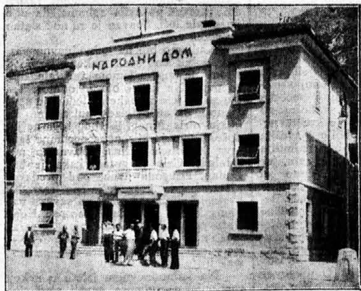
Narodni dom u Risnu ujedno i Sokolski dom

Svečano otvorenje doma sledilo je 6. septembra na Prestonasledniku