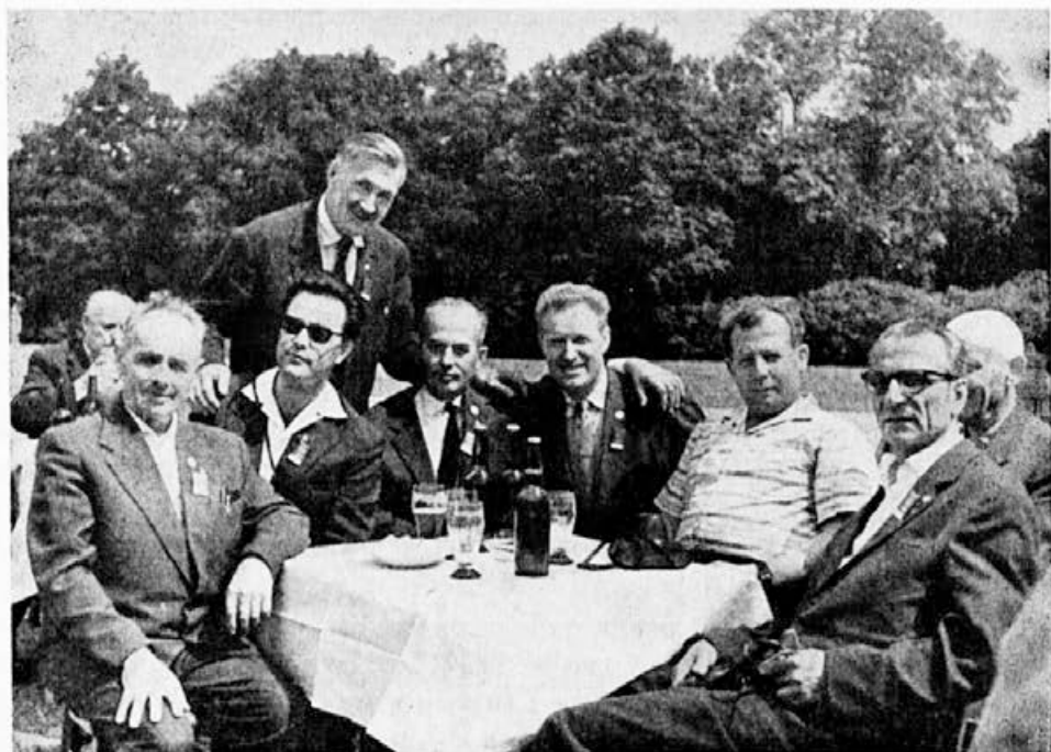
Jugoslovanski delegati na kongresu v Pragi v razgovoru s predsednikom Zveze čehoslovaških čebelarjev tov. Kodouom (v sredi)

Prav zaradi tako vsestranske dejavnosti APIMONDIJE se čutimo slovenski čebelarji še bolj povezani z njo. Pri tem pa seveda ne smemo