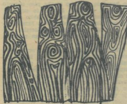
Vinjeta: Božidar Grabnar

9. Kje je ključ za napredek univerze? Če bi bil to samo en, docela neznan ključ, bi poklicali na pomoč vlomilce. Toda to