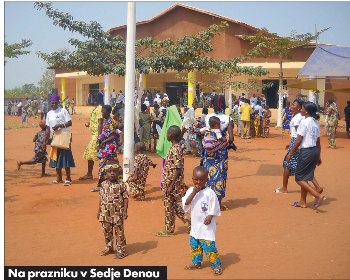
Na prazniku v Sedje Denou

čni ravni. Med ljudmi je nadvse priljubljen zaradi skromnosti, poštene in vesele narave, odkritosrčnosti in poguma. Med praznično zahvalno mašo se v pridigi tudi tokrat ni bal javno obsoditi nepravilnosti in korupcije v po-