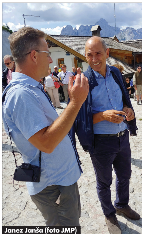
Janez Janša

Vprašanja o narodu so tudi ideološko nabita vprašanja. Pri nas še posebej. Poudarjanje nacionalnega, slovenskega, zlasti, kadar se to povezuje z etničnim in samobitnim, je namreč po mnenju nekaterih že spogledovanje s politično nekorektnostjo. Razlog naj bi bil v tem, da se na ta način Slovenci kot narod vzpostavljamo šele prek "drugega", torej tujca, ki smo ga po osamosvojitvi našli v državljanih drugih nekdanjih jugoslovanskih republik. Na kratko: da smo Slovenci že od osamosvojitve dalje nekakšni negativni nacionalisti. Zakaj? Najbrž zato, ker je že v Preambuli Ustave zapisano, da smo Republiko Slovenijo vzpostavili Slovenci, ki smo "v večstoletnem boju za narodno osvoboditev izoblikovali svojo narodno samobitnost in uveljavili svojo državnost", s čimer je "slovenski narod /.../ uresničil večstoletni boj za narodno osvoboditev, v katerem smo Slovenci izoblikovali svojo narodno samobitnost in uveljavili svojo