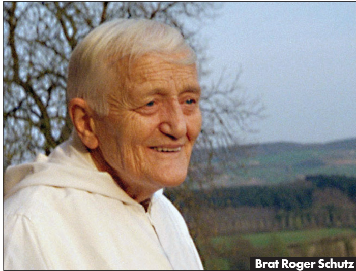
Brat Roger Schutz

Dan po Velikem šmarnu je leta 2005 svet zagrnil v žalost. Umorjen je bil ustanovitelj ekumenske skupnosti Taize brat Roger Schutz. Več kot 10.000 mladih, nekaj deset državljanov in predstavnikov svetovnih religij ga je pospremlilo k večnemu počitku. Da je bil svetniški stavec kruto umorjen, je takrat pretreslo svet, tudi Slovenijo. Brat Roger je namreč duhovno vplival na mnoge generacije mladih Slovencev. Pravzaprav vpliva še danes. Ekumenska meniška skupnost bratov iz Taizeja je bila ustanovljena leta 1940 v viharju druge svetovne vojne. Skupnost je Schutz ustanovil v vasi Taizé v bližini francoskega Lyona. Protestant švicarskega rodu je okrog sebe začel zbirati mlade in jih navduševati za medverski dialog. Ustanovil je preprosto in skromno meniško skupnost, ki je odprta tudi za nekrščanske religije. Danes se v francosko vasico zgrinjajo množice mladih z vsega sveta. Na njihovi spletni strani so tudi slovenske strani (taize. fr/sl). Romanja iz Slovenije sicer organizira Katoliška mladina, naslednica Skama. Taizéjska skupnost ni nikoli imela namena ustanoviti