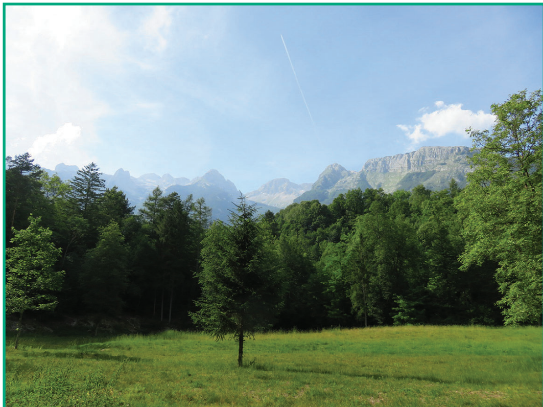
ŠK - pogled z mesta nesreče, 16. junij 2019