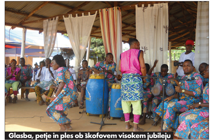
Glasba, petje in ples ob škofovem visokem jubileju

Nekega dne se sredi tržnice v Cotonouju začnem smejati, ko vidim star kamion bež barve s ka-