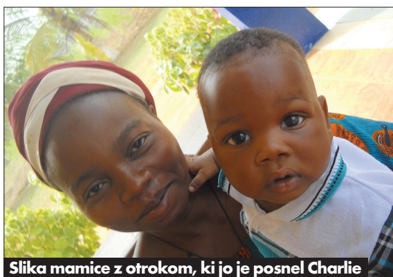
Slika mamice z otrokom, ki jo je posnel Charlie

litiki. Drugi del praznovanja je potekal na velikem odprtem prostoru pred cerkvijo. Veliko okusnih jedi, tradicionalna glasba, ljudska glasbila, pesmi in plesi, ki so se jim pridružile tudi redovnice, in vsa ta množica veselih ljudi v pisanih oblačilih je dogodek, ki mi bo za vedno ostal v spominu. Moji tedni v mestu Allada so se bližali koncu. Velikokrat mi je bi-