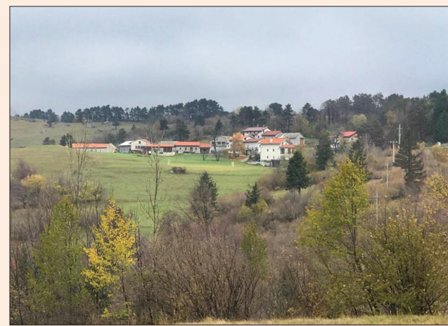
Izdilne vasice Okroglo (Kal nad Kanalom) izhaja rodbina Okroglič.