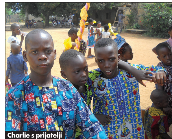
Charlie s prijatelji

Srečanje predstavnikov Karitas Koper in Gorica