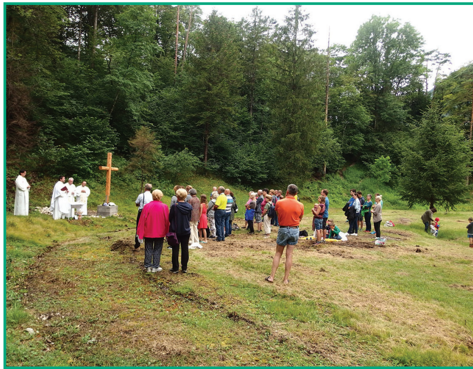
Sveta maša za ŠK, 9. julij 2019

jevanju žledu (februar, 2014) in v Sprejemnem centru za begunce v Brežicah (2015).