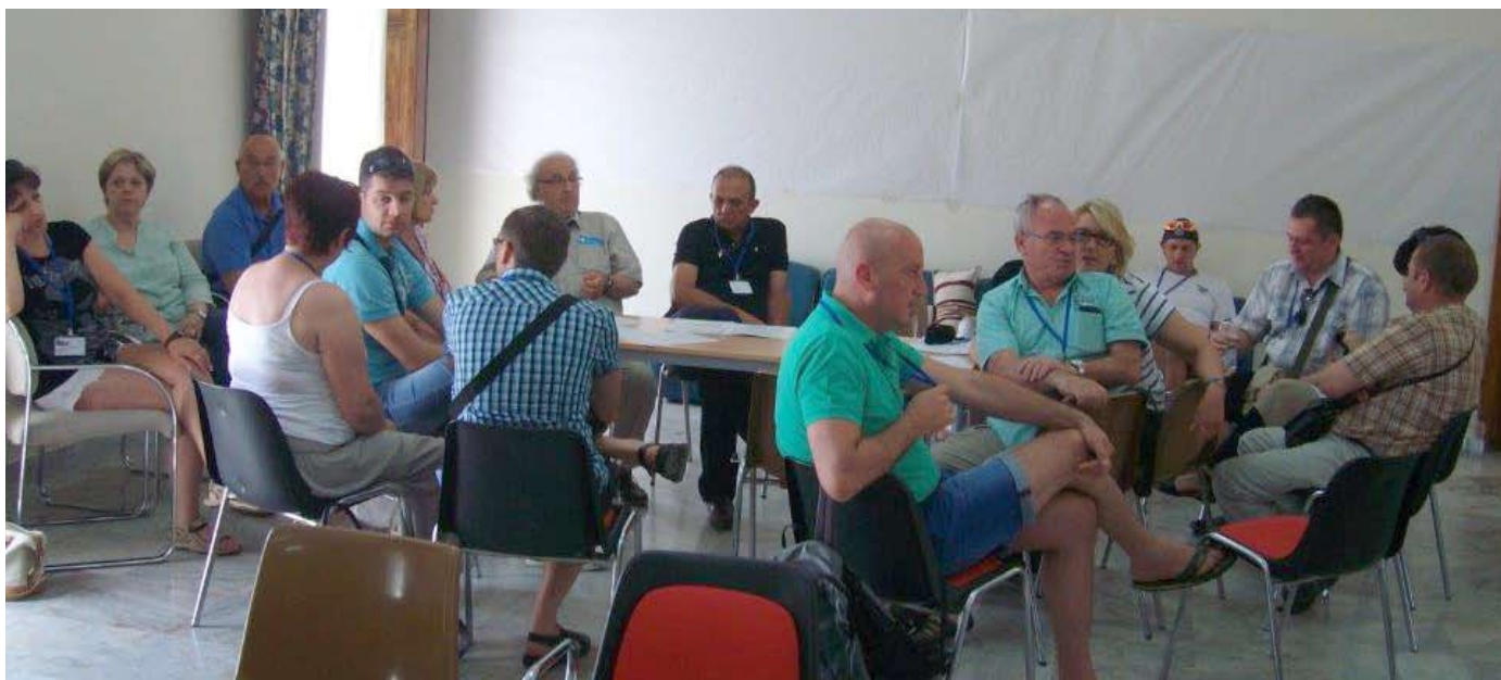
V skupini so poleg Slovenije sodelovale še Češka, Estonija, Latvija in Ciper