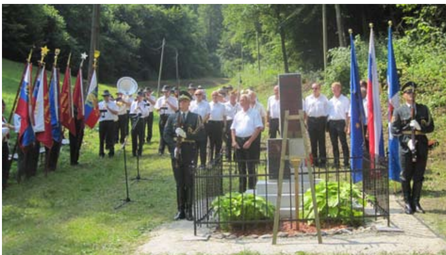
Spomenik, nastopajoči, praporščaki in garda slovenske vojske

Ministrica za obrambo RS Andreja Katič je v svojem govoru dejala, da po sedemdesetih letih od konca vojne lahko le slutimo, kakšno grozno bol je prizadel okupator našim ljudem. Poudarila je, da so boj Generala Maistra za severno mejo, narodnoosvobodilni partizanski boj med drugo svetovno vojno in vojna za Slovenijo, temelji današnje države Slovenije. »Borke in borci – udeleženske in udeleženci narodnoosvobodilnega partizanskega boja ste vedeli, da bo težko. Da bodo mnogi med vami v oboroženem boju s številnejšo okupatorjevo vojsko izgubili življenje. Sprejeli ste težko, a hkrati za domoljube edino mogočo odločitev. Junaško ste se uprli okupatorju, ki je sklenil naš narod uničiti.