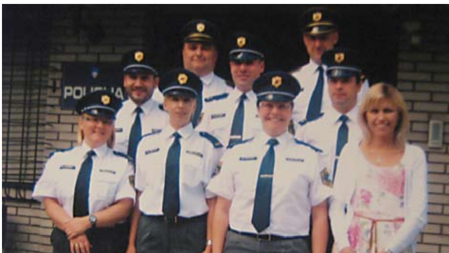
Policisti in policistke PP Domžale

Kulturni del slovesnosti je prispeval or-