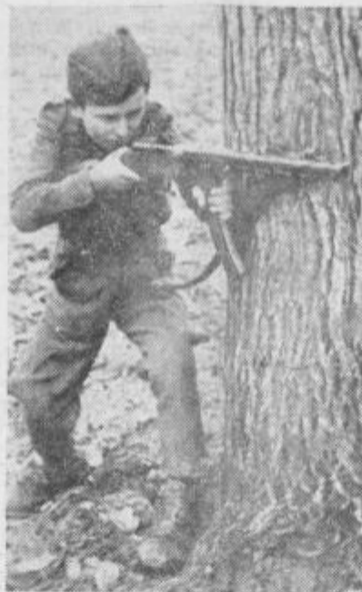
Brigadni kurir iz časa NOB, ki je padel v borbi.