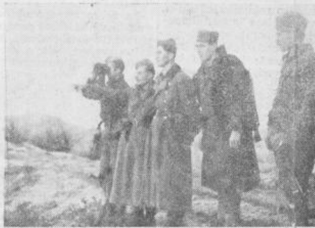
Prvi štab 7. srbske brigade, predhodnika današnje celjske vojaške enote.

Navzoči vojniki in vodstvo je spremljalo govornike z burnimi medvzkliki in navdušenim skandiranjem. Na njih obrazih ni bilo težko razbrati odločno