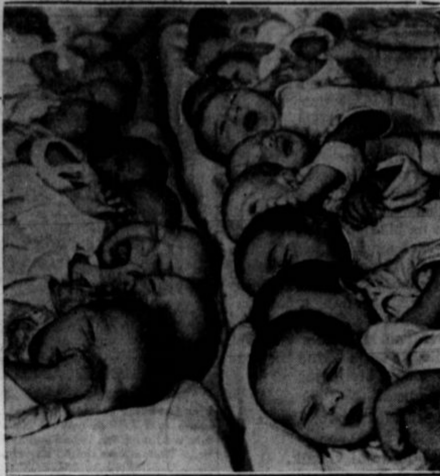
Pravijo, da Mussolinijeva kampanja za čimhitrejšo množitev prebivalstva Italije uspeva. Porodnice so polne, ker je za poročeno Italijanko zdaj nečastno, če ne rodi veliko otrok, kolikor jih ji bog da — namreč toliko, kot ji narava dopušta. Vse Italijanke, ki rade v gotovem roku najmanj štiri otroke, dobe $150 nagrade. To je v Italiji še precejšnija imovina, zato se je marsikak zakonski par polakomni, Mussolini pa ima s tem čimveč hrane za topove. Gornja slika je iz porodnice v Rimu.