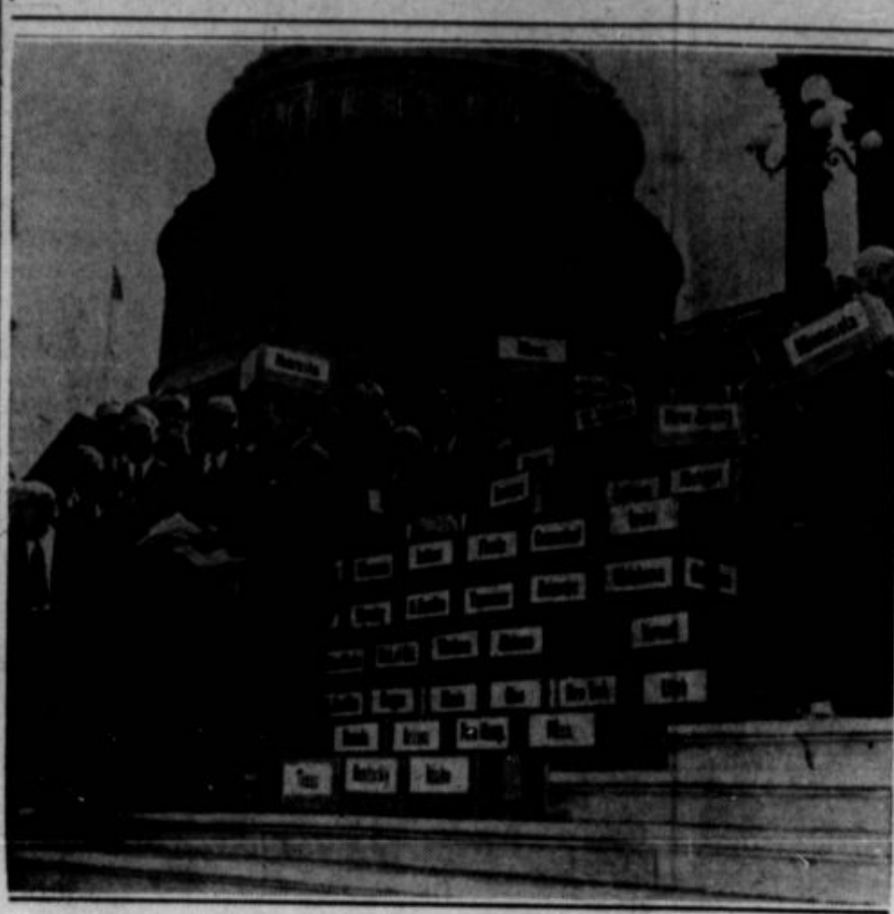
Štiri milijone podpisov veteranov, ki so bili v vojni službi Zed. držav izven njih mej, je podpisalo peticije, v katerih apelirajo na vlado, da naj ne nasede kakih novi vojni propagandi. Na gornji sliki so paketi s peticijami in pa deputacija veteranov, ki jih je izročila kongresu.