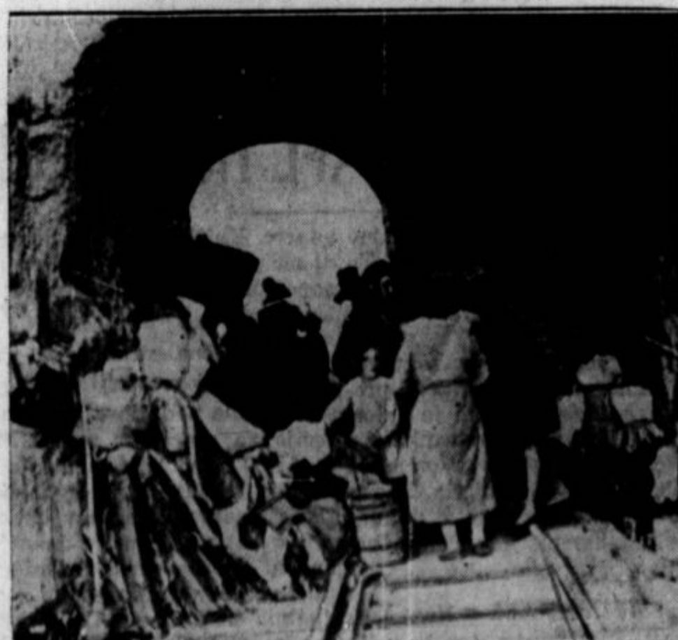
Na sliki je zapučen železniški tunel v Madridu, ki služi v sedanji civilni vojni prebivalstvu za zavetje pred aeroplani. Zivljenje v njemu je kajpada jako neugodno.