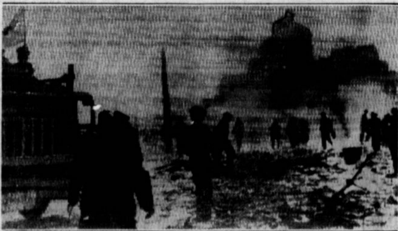
Slika iz Barcelone v Španiji, ko je bilo bombardiranje iz zraka na višku. Bila je poslana ameriškemu tisku po radiu (električnem odtisku). Napadi na civilno prebivalstvo se nadaljujejo.

CUNARD WHITE STAR 32 NO. MICHIGAN AVENUE CHICAGO, ILL.