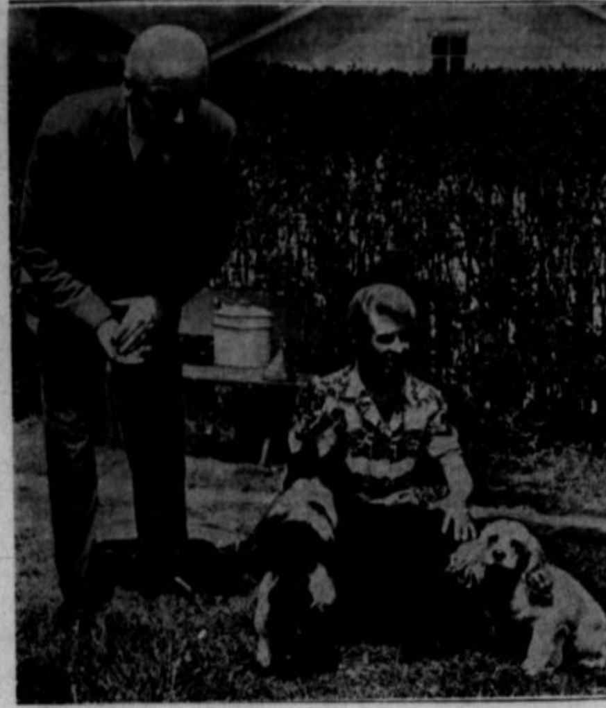
Norman Thomas, ki je bil nedavno nasilno izgnan iz Jersey Cityja, kjer je skušal govoriti na shodu, je vložil proti županu imenovanega mesta tožbo radi kršitve ustave. Na sliki poleg Thomasa je njegova žena, ki je bila z njim. Eden izmed policajev je udaril po obrazu. Dostikrat spremljuje Thomasa po shodih na vzhodu tudi njegovi otroci, ki so že vsi poročeni.