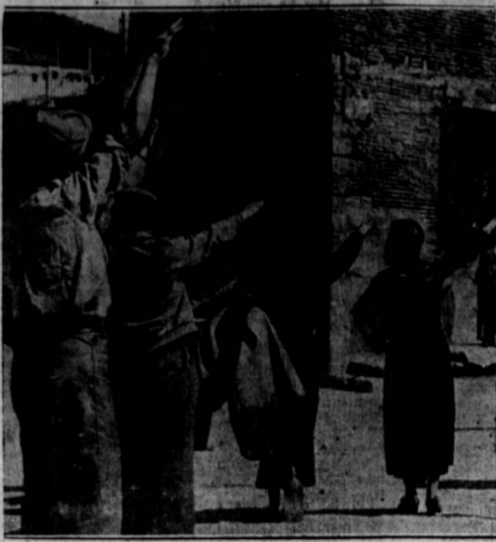
Ameriški časniški poročevalci so brzojavili iz Leride v Španiji, da ko hitro so fašisti s pomočjo italijanskih polkov zavzeli te kraje, so mnogi prebivalci, ki niso pobegnili, sprejemali svoj "pozdrav". Prej so dvigali roke v pozdrav s stisnjenimi pestmi. Ko so pa prišli v njihove kraje fašisti, so jih pozdravili po fašistično, kot vidite na goraji sliki.