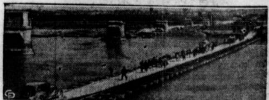
Umikajoči lojalisti so za sabo razstrelili most, toda rebeli so zgradili kmalu pantsongsa in prodrali dalje. Zmage v poslednjih tednih so jim omogočili italijanski polki ter nemški in italijanski vojni aeroplani.

ZA LICNE TISKOVINE VSEH VRST PO ZMERNIH CENAH SE VEDNO OBRNITE NA UNIJSKO TISKARNO