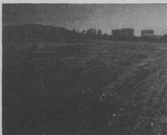
Dve leti je čakalo fužinsko gradbišče