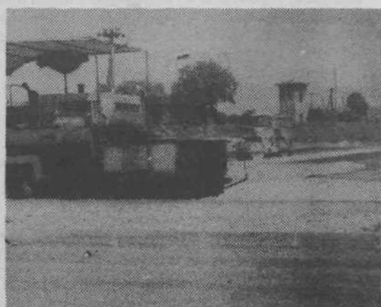
Sedaj so drugič zahrneli stroji — upajmo, da ne bodo več utiheli