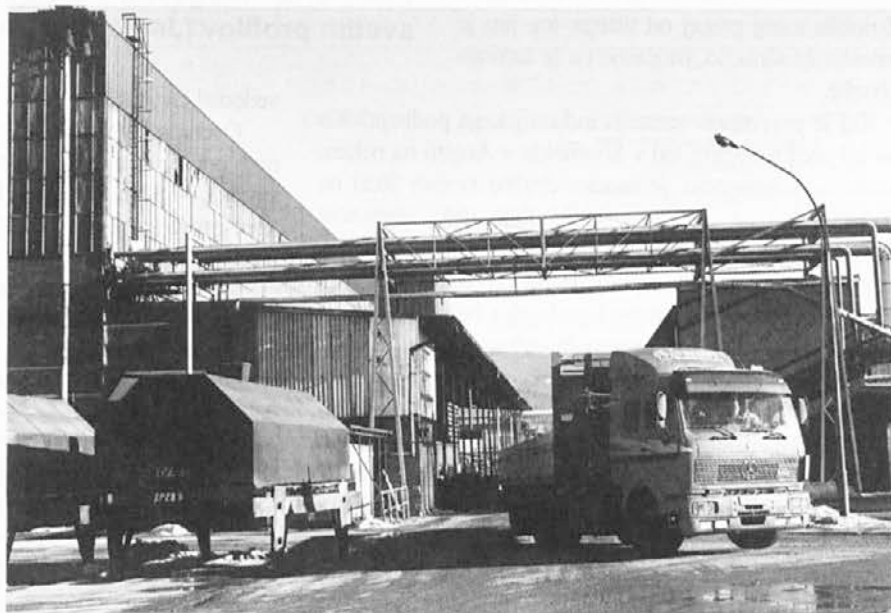
V Metalu so lani izdelali več kot 83.700 ton tekočega jekla.