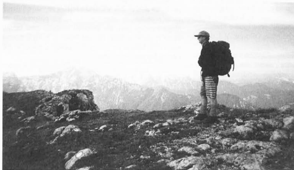
Na vrhu Raduhe (2.062 m)

V soboto smo se ob 6. uri zbrali pred ravenko železarno in se odpeljali skozi Mislinjsko dolino, dalje po Savinjski dolini do Ljubnega, kjer je bilo zbirališče vseh planinskih pohodnikov – slovenskih železarjev. Po srečanju in pozdravu smo z avtobusi skupaj nadaljevali