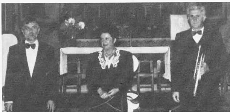
Trio Barocco Forte