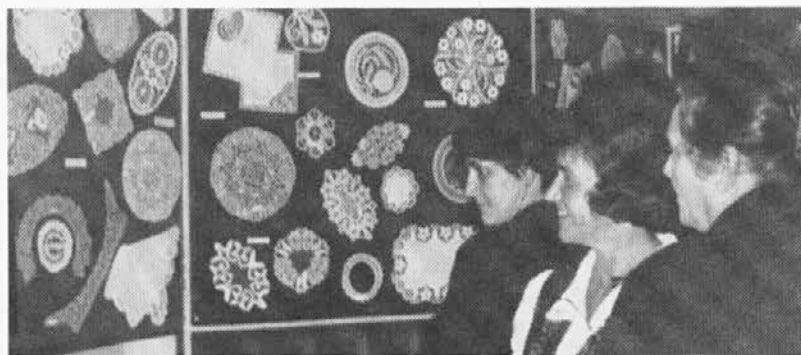
Razstava čipk v Družbenem domu na Prevaljah

28. septembra so v Kulturnem domu v Kotljah ustanovili Prežihovo ustanovo, namenjeno napredku Koroške. Njen sedež je v Ljubljani, sredstva pa naj bi namenjali za študij koroških študentov, za znanstveno-raziskovalno, kulturno-