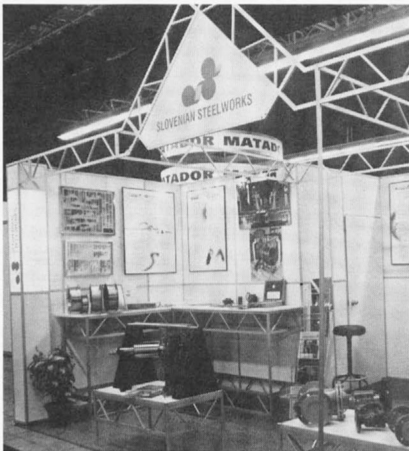
Slovenske železarne so se predstavile tudi na mednarodnem sejmu strojegradnje v Brnu na Češkem

Čeprav podrobnejše analize sejmskih dejavnosti še niso v celoti pripravljene (bodo pa podlaga za načrtovanje le-teh v prihodnjem letu), je že mogoče reči, da je bila udeležba predstavnikov družb na sejmihi uspešna. Številne obiskovalce, med katerimi so bili tudi mnogi iz podjetij, ki