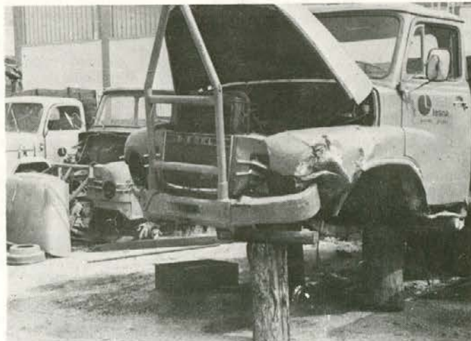
Bomo delili usodo s tem veteranom?