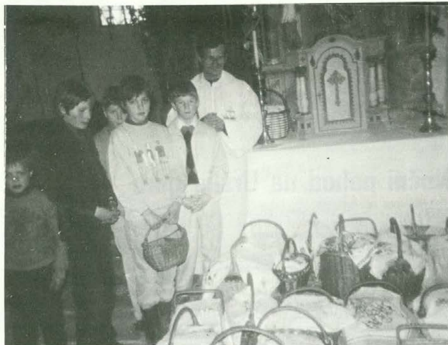
Na veliko soboto 1989