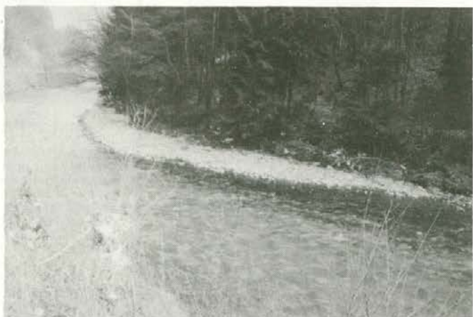
Meža spomladi cveti, šele zelenje prekrije naše grehe.