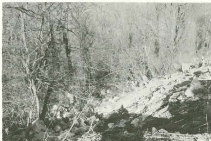
Divjih odlagališč na Koroškem kar mrgoli