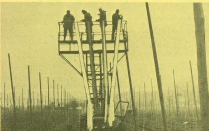
Obešanje vrvice — spomladansko delo v hmeljišču