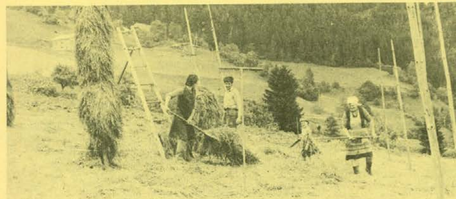
Dobro pripravljena »paška« krma

»Rad bi poudaril«, mi je ob koncu najinega pogovora dejal Jože: »da so nas pri našem prizadevanju vsi od kraja podprli./Izvršni