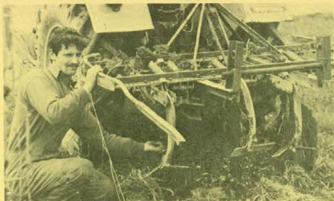
Kultivator za hmelj

V svoji prodajni mreži »MESNINA« prodaja tudi meso, nabavljeno od drugod, in sicer največ svinjine (355 t) in perutnine (243 t), saj te proizvodnje v Koroški zadrugi ni dovolj. V primerjavi z letom prej so se povečale le nabave svinjskega mesa.