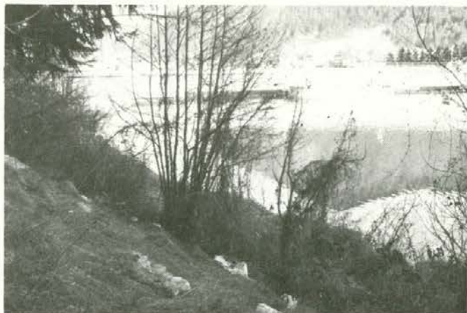
Bregovi Drave spomladi