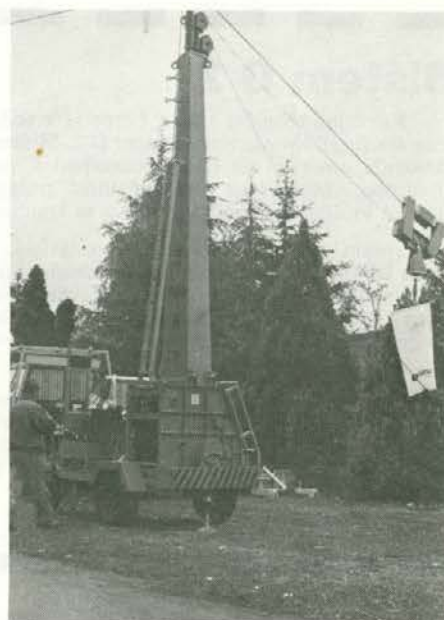
Gozdarska žičnica z avtomatskim vozičkom

Ko smo ustanavljali delavnico v Pamečah, smo se slepili, kako založeno bo centralno skladišče strojnih delov. Skladiščnikom na TOZD ne bo treba drugega, kot javiti potrebe in skupna nabavna služba bo poskrbela za vse ostalo. Danes pa si moramo ustvarjati zaloge na TOZD Sami, če hočemo, da proizvodnja nemoteno poteka. Gume, verige, drsniki, žične vrvi, pa rezervni deli za motorne žage, požirajo na razdrobljenih skladiščih veliko več sredstev, kot pa jih na skupnem in res ekspektivnem skladišču, kjer bi bil vsak potreben del res dosegljiv v vsakem času. Danes so police v za ta namen postavljenem skladišču prazne. Res je velika škoda, da lepe ideje v