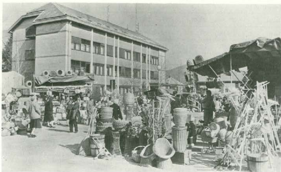
Letošnji Jožetov sejem v Slovenj Gradcu je bil eden najbogatejših doslej, F. Jurač