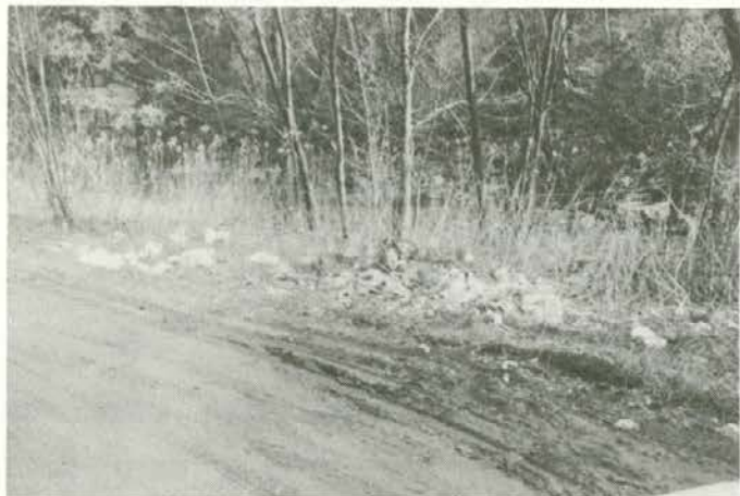
»Počivališče« za vozila ob cesti Dravograd—Ravne