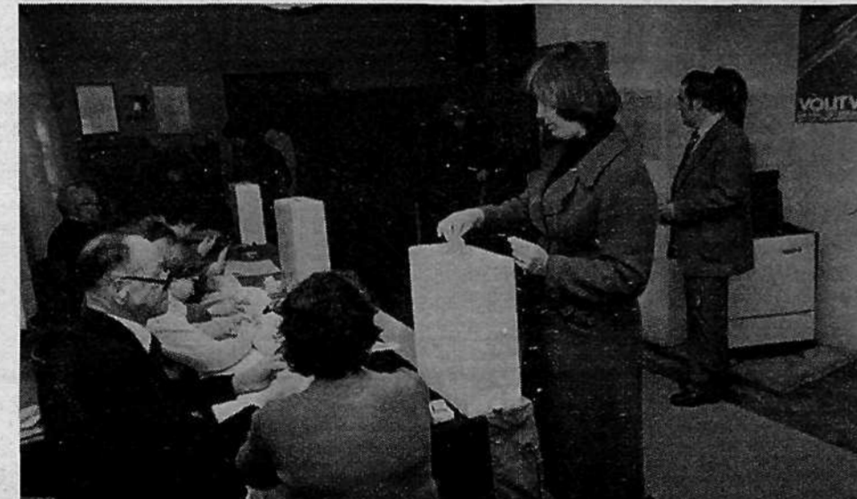
KS STARA LJUBLJANA, VOLIŠČE 11 – vpisanih 723 volivcev, ki so volili eno združeno za otroško varstvo, socialno skrbstvo, invalidsko-pokojninsko zavarovanje in zaposlovanje in šest posebnih delegacij za skupščine SIS.

Trudila se bom, da bom resnično zastopala interese naših krajanov.