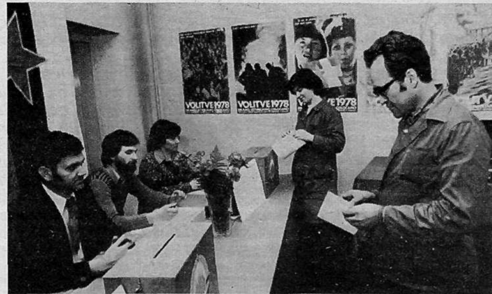
DO TOVARNJA BATERIJ ZMAJ – 327 vpisanih volivcev. Posebne delegacije so volili za raziskovanje, stanovanjsko gospodarstvo in zdravstvo; združeno za zaposlovanje, invalidsko-pokojninsko zavarovanje, otroško varstvo in socialno skrbstvo; združeno za vzgojo in izobraževanje, kulturo in telesno kulturo.

Za združeno delegacijo smo se odločili zaradi sorodnosti področij. Naša naloga bo tudi pomagati starejšim občanom, pri čemer bomo še posebno pozornost namenili borcem. V delegacijo smo predlagali delegate, ki jih poznamo in vemo, da bodo delali.