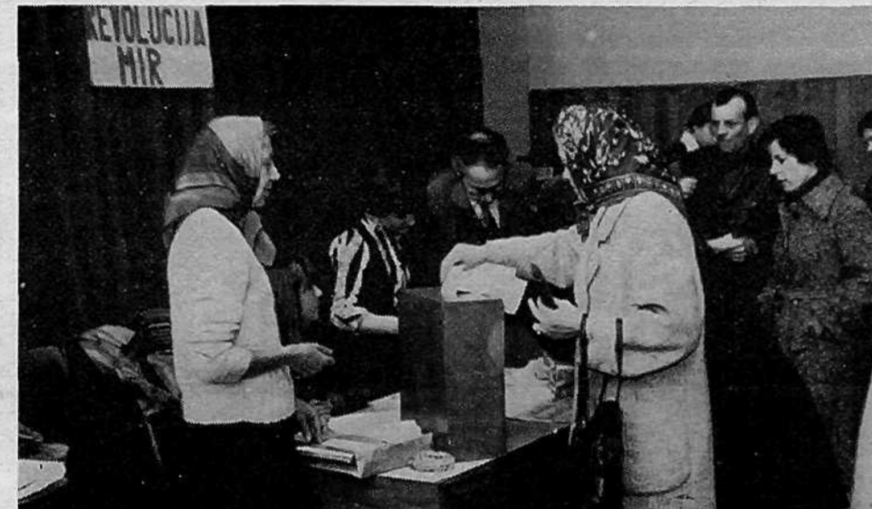
KS PRULE, VOLIŠČE 21 – vpisanih 1059 volivcev. Za vse SIS so volili posebne delegacije.

Priprave na volitve so bile pravočasne in obsežne. Delo delegatov sem spremljal, odločitve za splošne delegacije pa je nedvomno zelo dobra, saj bomo imeli za delegate boljše stike, kar zagotavlja obojestransko boljše obveščeno.