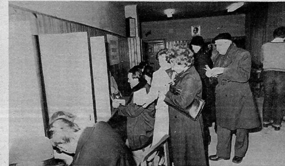
KS GRADIŠČE, VOLIŠČE 5 – vpisanih 1216 volivcev. Združeno delegacijo so volili za invalidsko-pokojninsko zavarovanje in zaposlovanje, za druge SIS so volili posebne delegacije.