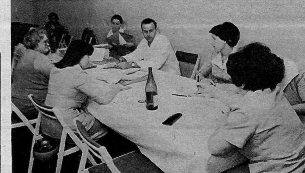
KLINIČNI CENTER, TOZD KIRURŠKA SLUŽBA – na 13 voliščih je bilo vpisanih 1150 volivcev. Za vse SIS so volili posebne delegacije. Volili so še v delavski svet TOZD in centralni delavski svet, komisijo za samoupravno delavsko kontrolo in disciplinsko komisijo.