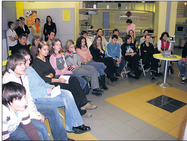
Mladi parlamentarci so spregovorili o tabujih.

Uživanje drog samo po sebi ni tabu, saj kajenje in pitje alkohola v družbi nista prepovedana. Kajenje in uživanje alkohola sta proti koncu osnovne šole za mnoge otroke prav zaradi prepovedi način dokazovanja poguma in vključevanja v družbo, hkrati pa je oboje zanje tabu v odnosu do staršev in učiteljev.