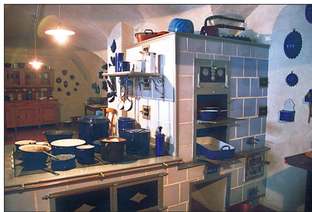
Kuhinja v gradu Herberstein, ki je od Gradca oddaljen okrog 60 km, v kateri prevladuje posodje v modrem, modra barva naj bi odganjala mrčes.

je vse pogrel plemiški sprejem v dvorani z družinskimi portreti in kaminom, ki so ga posebej za to priložnost tudi zakurili, postregli pa s plemiškim čajem. Udeležence ekskurzije je na poti v celoti zalagal bife bus, ki so ga pomagali zapolniti tudi tisti, ki so ostali doma zaradi takšnih ali drugačnih razlogov. Posebej pa so teknile dobrote Gostinstva Perutnine Ptuj. Grad Herberstein na avstrijskem Koroškem diha kot življenjski prostor v primerjavi s ptujskim gradom, kjer gre za muzejsko postavitev. Primerjava pokaže, da se ptujski grad ponša s kvalitetnimi muzejskimi predmeti in zanimivimi zbirkami, prav tako z nadvse kvalitetno vodniško službo, manjkajo pa mu drobni predmeti in ženski portreti, prav tako tudi hortikulturno urejene in doživljajske površine, ki pomagajo zadržati goste v gradu in njegovi okolici za dlje časa, za štiri in več ur, ko obiskovalec postane že lačen in žejen, zato je v kompleksu