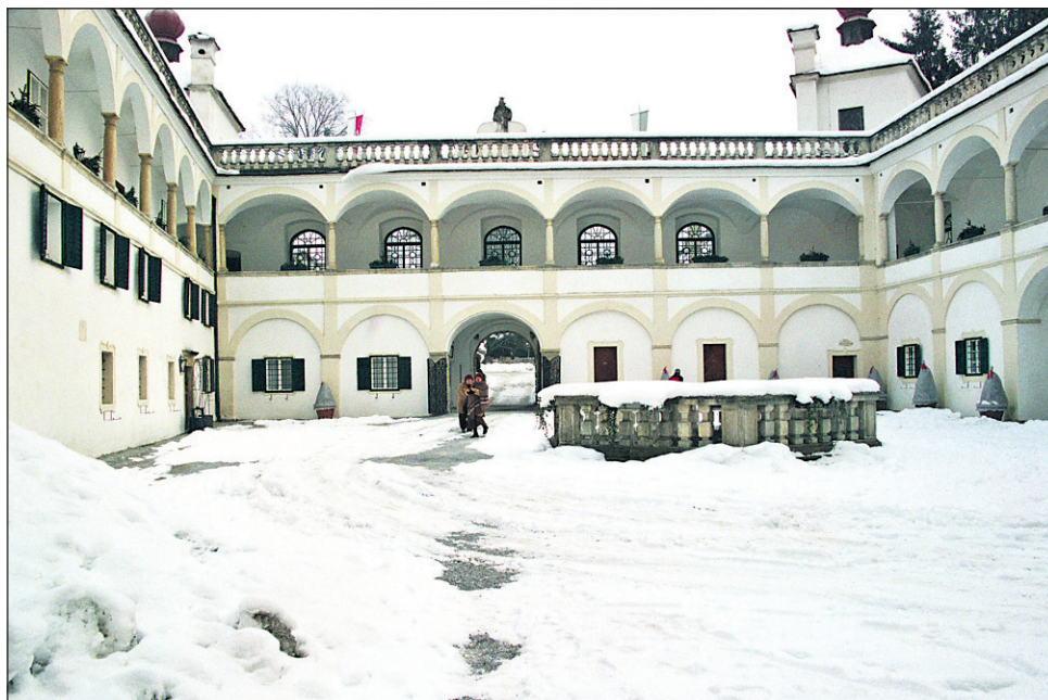
Grad Herberstein je doživel številne obnove in dozidave, od leta 1320 je neprekinjeno v lasti družine Herbersteinov, znamenite plemiške družine, ki je pomembno vplivala na zgodovino naših krajev. Na fotografiji florentinsko dvorišče, ki ga poleti krasijo številne rože in okrasno zelenje. Območje gradu je veliko 40 ha, poleg gradu vabijo tudi številne urejene zelene površine, ki so še posebej privlačne za obisk družin.