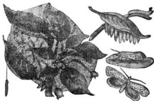
Pod. 13. Jabolčni molj.

Jabolčni molj ( Hyponomeuta malinella ). K rodovini moljev spada razen prej imenovanega tudi črešnjev molj ( Argyresthia eppipella ). Ti mali metuljčki, oziroma gosenčice se polotijo včasih raznega sadnega drevja pogostoma celo zapazimo