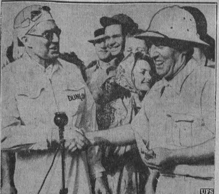
Kapitan George Eyston iz Anglije je vozil svoj avto na rekordni vožnji 345.49 milj na uro ter pobil celo svoj prejšnji rekord. Vozil ga je na dirkališču Bonneville, Utah.