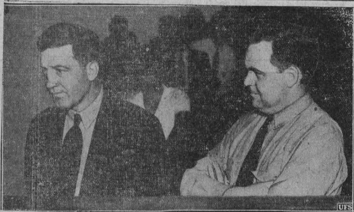
Dva izmed paznikov, ki sta bila spozna na krivim, da sta nalašč odprla paro v jetniško celico, kjer so se štirje jetniki zadušili.