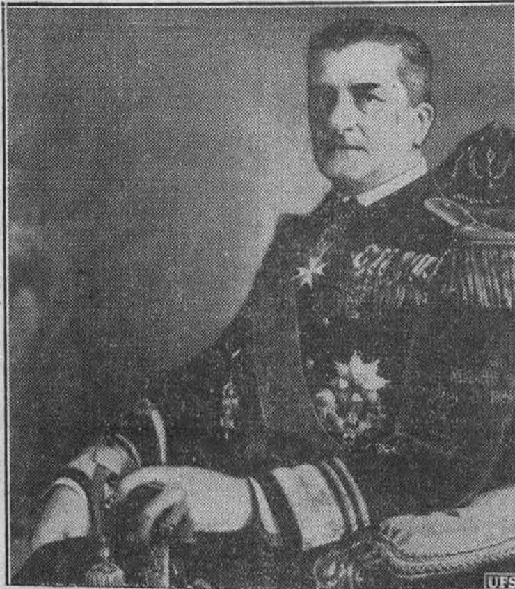
Admiral Horthy, diktator Ogrske, ki se nagiblje želo k Nemčiji zadnje čase.

— Gorje onemu, ki bi ga prekršil! — vzklikne Simonovna. — Če tudi je naš narod slab in podjarmljen, vendar ne bi dopustil, da se prekršijo prastari sibirski zakoni! — In ti si zares pripravljel-