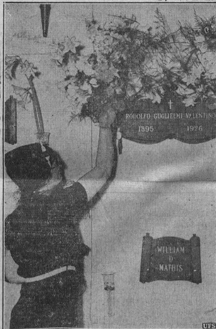
Zenske še vedno nosijo vrvec na grob slavnega filmskega igralca Rudolfa Valentina, čeprav je že 12 let v grobu. Večinoma pridejo te njegove oboževalke z gostim pajčolanom, da jih ljudje ne spoznajo.