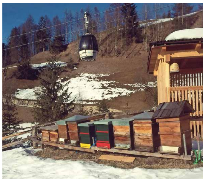
Zima se končuje... Panji na robu smučišča; San Vigilio di Marebbe, Italija.