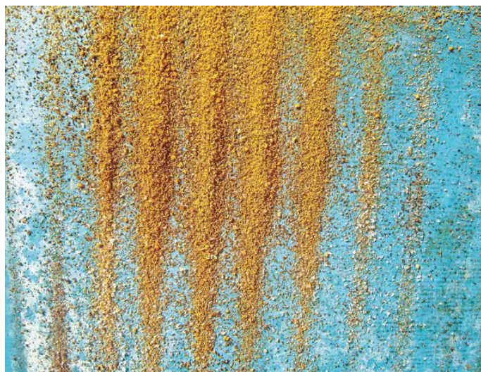
Za osnovno diagnostiko zadostuje pogled na testni vložek z zimskim drobirjem.

Zadeva je še kompleksnejša, ampak gremo po vrsti. Menim, da idealnega panjskega sistema ni, in tudi nimam želje po prepiranju glede tega, vsak ima svoje prednosti in slabosti, smiselna je optimizacija dela. Hitro sem ugotovil, da je ekonomska dodana vrednost pri medu zelo nizka (več o tem kdaj pozneje), in sklenil, da me v količinskem smislu to ne zanima in se tudi ne