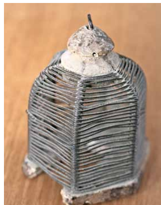
Originalna hišica za matice, matičnica iz Levstikovega obdobja

Čeprav je Bučelstvo napisal po mentorjevih izkušnjah in besedah, je iz pisanja razvidno, da je sam prebral nekaj takratne slovenske in nemške literature, čeprav je ni bilo