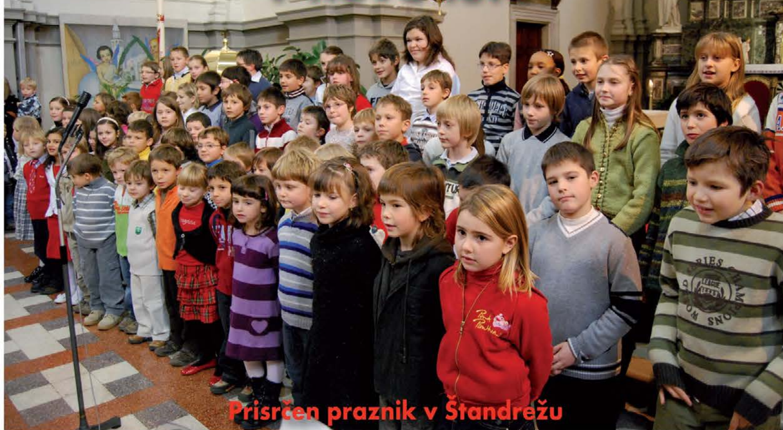
Prisrčen praznik v Štandrežu