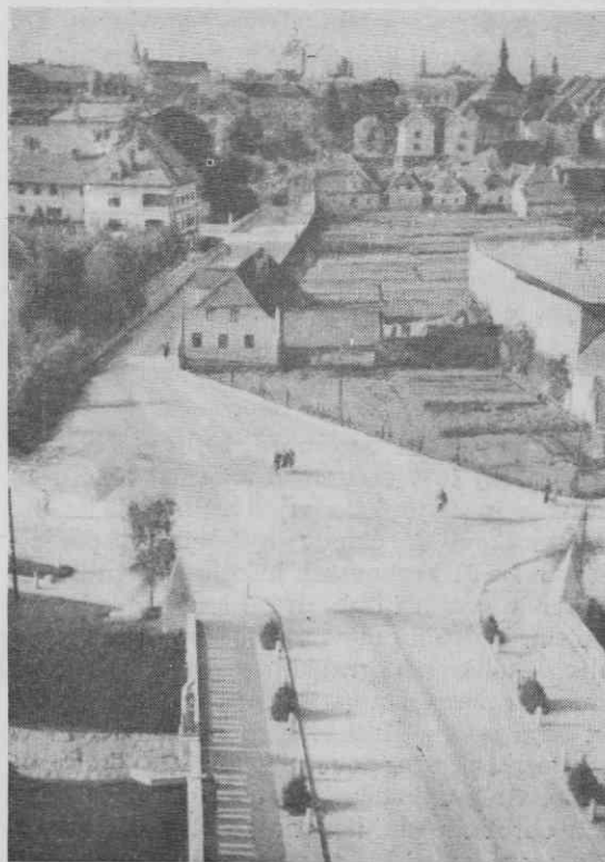
Krakovski vrtovi z Emonske ceste

Pri naslednjem štetju 31. decembra 1869 je bilo vprašanje po poklicu, zaposlitvi in zna-