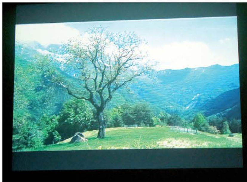
Posnetek iz dokumentarca o rezijanskem pesniku Renatu Quaglii

Il consigliere regionale sulla proposta di riforma sanitaria