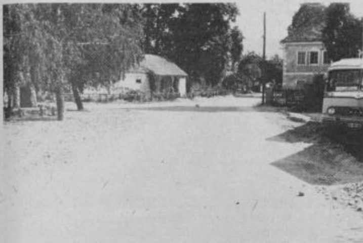
Trg na grabah. Prostor okrog spomenika padlih v I. svetovni vojni.

članov po vaseh, na katerih so obravnavali program del za letos. Dogovorili so se, da bodo potrebna sredstva zagotovili tako, da krajevna skupnost prispeva sredstva krajevnega samoprispevka za naselje Središče, občani vse krajevne skupnosti pa prispevajo še poseben prostovoljni prispevek — 200,00 din po gospodinjstvu. Za prispevke je krajevna skupnost prosila tudi delovne organizacije in občinsko