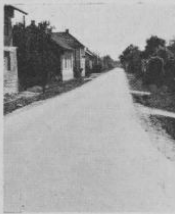
Cesta na železniško postajo.

skupnosti Središče ob Dravi skoraj končan. V kratkem bo razpisan nov referendum, na katerem se bodo občani odločali za nov samoprispevek za nadaljnjih pet let.