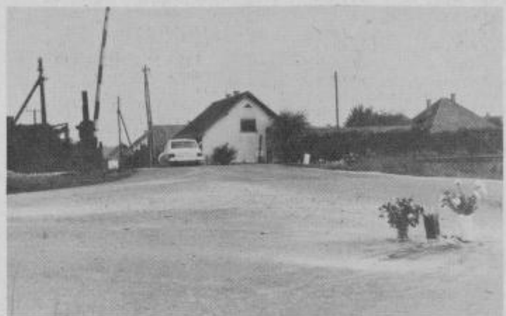
Takšni prizori se večkrat pojavljajo v tem križišču.