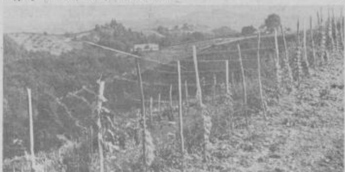
Vinogradi v Halozah

Letošnje odkupne cene še niso znane, zato jih ne moremo objaviti. O cenah bomo poročali v glavni sezoni trgatve. Vsak sončen jesenski dan mnogo pomeni za dvig kakovosti vinskega pridelka. Toplo jesensko sonce – RUJNO VINCE. fs