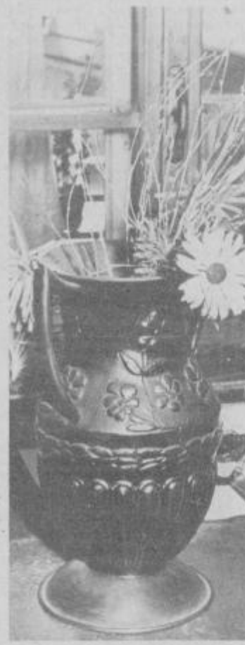
Kotlarski izdelki. Vse izdelke izdelava ročno

mehanizacije in je niti ne potrebujemo. Kupci so zadovoljni z našimi izdelki, saj so kvalitetni in z garancijo izdelani. Vse storitve so zelo poceni in primerne za ljudi iz okolice.