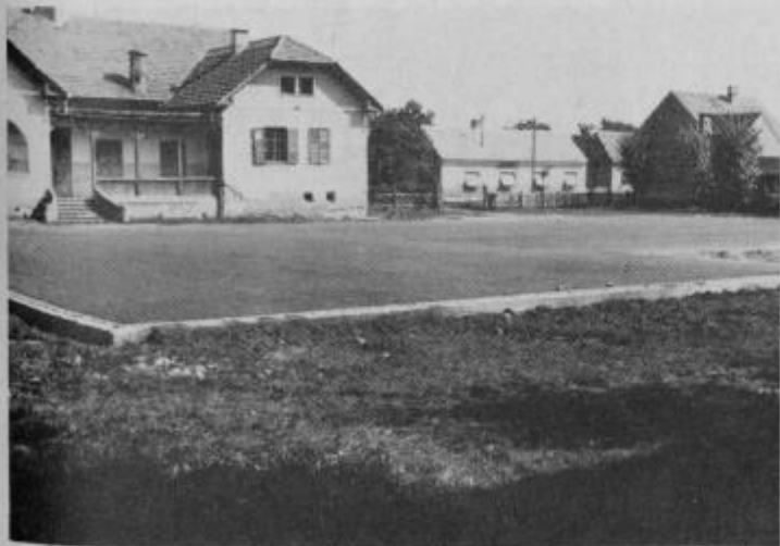
Novo roketno igrišče na prostoru med osnovno šolo in domom Partizana.

Tako zastavljena akcija je uspešno stekla. Dela so se delno povečala s tem, da je krajevna skupnost ob lastni finančni udeležbi pristopila k navozu gramoza in drugim pripravam. Med asfaltiranjem so se letos občani močno angažirali in poskušali stisniti čim več asfaltiranih površin zato so se le te povečale od planiranih in je zaradi tega tudi porastel znesek vrednosti del na dokončno ceno 445.564,00 dinarjev. Tako je Središče dobilo nova 2 kilometra asfaltiranih cest, kar je 9.399 kvadratnih metrov asfalta. Dela je izvajalo stanovanjsko komunalno podjetje Ormož s svojim kooperantom — cestnim podjetjem