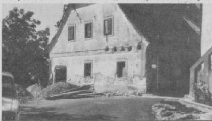
Stara, vendar dobro ohranjena zgradba bo po temeljiti obnovi postala nov in topel dom za otroke.

Iz stanovanskega dela hiše in velikega prostora za stiskalnico bodo delavci gradbenega podjetja OGRAD Ormož uredili eno veliko in dve manjši učilnici, kuhinjo, ki