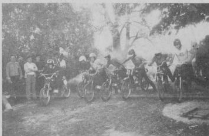
V Desnjaku pri Ljutomeru je 9. t. m. organiziralo gasilsko društvo motokros v zabavo navdušenih gledalcev.