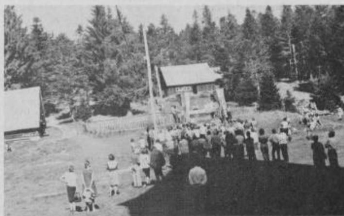
Trenutek svečanosti za PD IMPOL na bistriškem Pohorju.

tvornost posameznih članov, ki so ob pomoči ponovno naraščajočega števila članstva dosegali zavirljive uspehe. V nadaljevanju zaključne svečanosti so 31 mladim Bistričanom in okoličanom, ki so letos