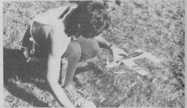
Favorit AK Ptuj polni z gorivom svoj zračni model

Kljub lepemu vremenu je bilo razmeroma malo gledalcev. Največ je bilo seveda radovednih otroških glav. V pogovoru s tekmovalci smo zvedeli, da je za ta sport povsod drugje veliko več zanimanja. Povedali so nam tudi, da so oseoli za