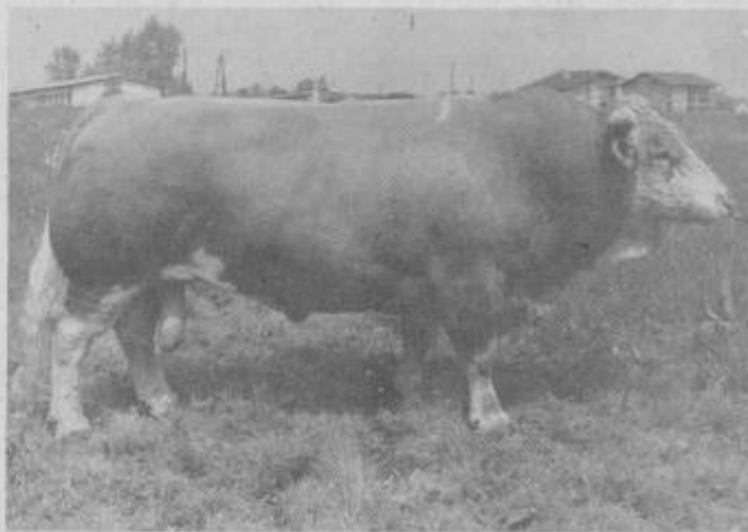
Bik hrast R 168, rojen 12. 3. 1964, višine vihra 145 cm, teža 1.180 kg.

različnih starosti. Lisasti bikovi so bili razvrščeni v sledeče plemenske razrede: