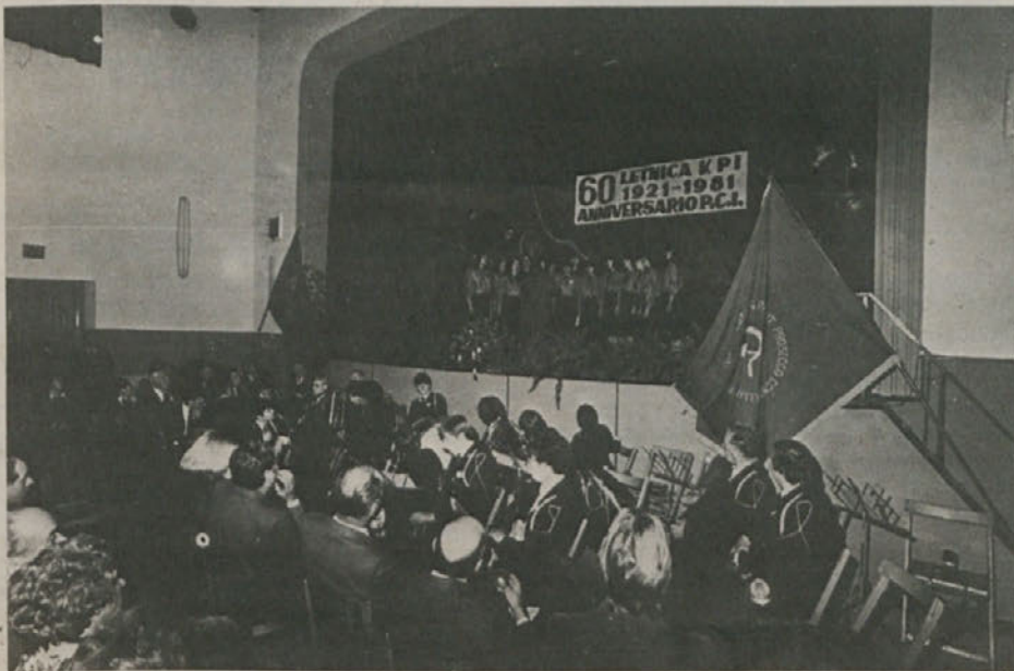
Proslava v Križu