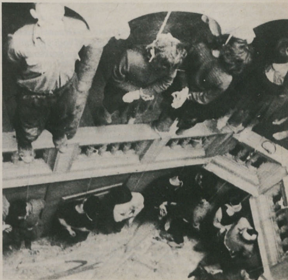
Obešeni talci v Ul. Ghega v Trstu, leta 1944

Misovcem pa vsekakor ne gre za izboljšanje italijanskega kazenskega zakonika, pač pa za prav nasprotno. Njihov cilj je, na valu gneva zaradi terorističnih dejanj, okrniti ustavne svoboščine, militarizirati italijansko družbo, stopiti še korak naprej na poti uveljavljanja diktature. Za to potrebujejo množično podporo in to podporo iščejo z zbiranjem podpisov za smrtno kazen. Mi jim teh podpisov ne smemo dati!