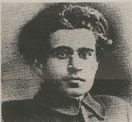
Antonio Gramsci (1891–1937)

Ko je Gramsci iskal odgovor na to vprašanje, je oblikoval vrsto izvornih teoretičnih analiz, ki niso dragocene le zato, ker pomenijo izvirni marksistični pristop k dani problematiki njegove dobe, marveč tudi zato, ker so aktualne še dandanes. Zanimive pa so tudi zato, ker niso omejene zgolj na problematiko revolucije v italijanskih razmerah (kot bi hoteli nekateri, ki Gramscija interpretirajo samo kot nekakšnega evrokomunisto ante litteram), marveč pomenijo splošno obogatitev zakladnice marksistične misli.