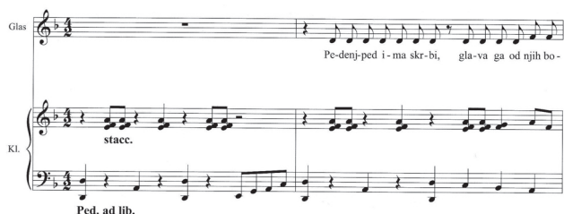
Slika 2: Primer »običajne« notne pisave (Vitja Avsec-bes. Niko Grafenauer, Pedenjsuita za 2-glasni otroški zbor s klavirjem, 1990 – začetek; v: Glasba v šoli in vrtcu/Notna priloga, L. XVI/2012, št. 1-2, Notna priloga, str. 7, Zavod RS za šolstvo, Ljubljana 2012).

Tonska višina je bila določena v obliki navodil za prijeme (za glasbila s strunami). Menzuralna notacija in tabulature pa so že poznale taktovske 4 oznake. Današnja notna pisava pa je nastala v 17. stol. Pomeni sistem petih (notnih) črt s ključi pred njimi in z dodanimi pomožnimi linijami (spodaj in zgoraj). Na črte in med nje vpisujemo note, pavze, predznake, dodatne napotke, kot so tempo, dinamika, artiklucija idr.