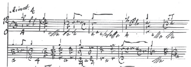
Slika 1: Primer tabulature Škofjeloškega pasijona (za lutnjo ali/in čembalo), Menuet (orig. hrani NUK-GZ, Ljubljana).

posebnosti nastopa samo v glasbi oz. njeni umetnosti in s tem tudi pismenosti. Gre za (posebno) grafično znamenje ali celo skupek znamenj za ton. Glasbeni zapisi so sestavljeni iz (notnih) znakov za določanje višine in dolžine tona, pavz in še drugih posebnosti; kot so npr. znaki za dinamiko, tj. razvrstitev stopenj jakosti in celo nauk o tem (glasnost), in agogiko, ki pomeni v glasbi izraz za različne modifikacije tempa za drobne spremembe v hitrosti izvedbe (pohitevanje in zaostajanje), s katerimi (določena) interpretacija doseže močnejši izraz in plastičnost le-tega. Notna pisava, ki izhaja neposredno iz (glasbenih) not, pa pomeni pismeni zapis glasbe. Ta je od svojega nastanka s prvotnim črkovnim zapisom nevm za koral (od 8. stol. dalje) doživel neverjeten razvoj. Potem, ko je Guido iz Arezza 1028 vpeljal (prve) štiri linije, črte, je z uporabo notnih ključev pred črtovjem (prvič) omogočil zapisati absolutno tonsko lestvico. Prav iz že omenjenih nevm pa se je ok. 1200 razvila kvadratna notacija, ki jo še danes uporabljajo v koralnih zapisih. Tako je večglasna glasba ok. 1180 našla možnost zapisa v modalni notaciji. Zdaj so lahko določali tudi relativno tonsko trajanje. Ok. 1240 je modalno notacijo zamenjala še natančnejša menzuralna notacija. Inštrumentalna notna pisava med 14. in 18. stol. se je imenovala tabulatura .