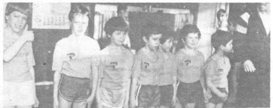
Zmagovalna ekipa ŠSD Vič

ORGANIZIRAJO V APRILU IN MAJU 1985 V ŠPORTNI DVORANI KRIM-RUDNIK, VSAK PETEK OD 20. DO 22. URE, BREZPLAČNO REKREATIVNO VADBO ZA KRAJANE, POD STROKOVNIM VODSTVOM. DRUŠTVA VAM PRIPRAVLJAJO MOŽNOST SPLOŠNE REKREACIJE, IGRE Z ŽOGO, IGRANJE BADMINTONA ALI NAMIZNEGA TENISA. ŠPORTNO OPREMO (COPATE, ...) TER LOPAR ZA BADMINTON – NAMIZNI TENIS, PRINESITE S SEBOJ. VLJUDNO VABLJENI!