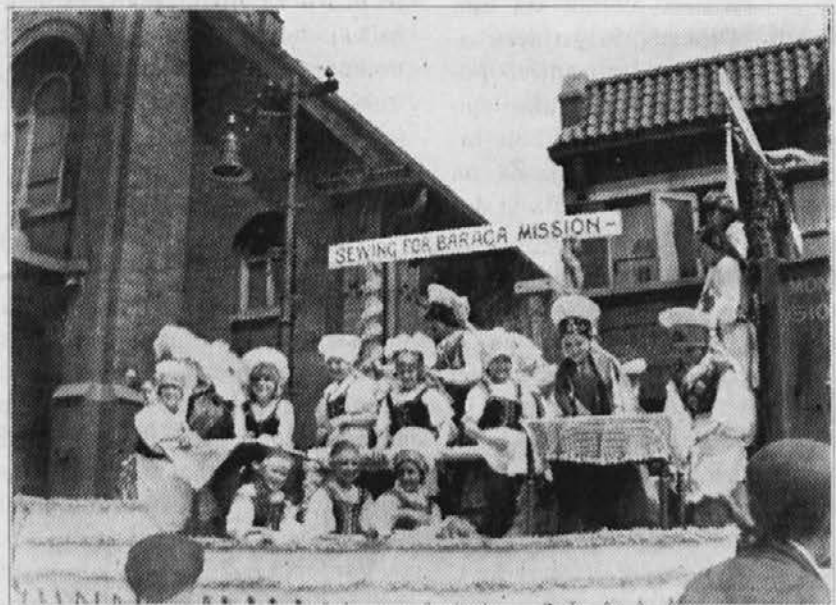
Kaj je naredila Slovenija za Amerikanske misijone.