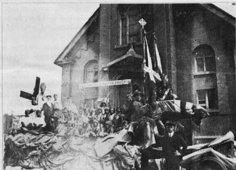
Otroci Sv. Štefana predstavljajo škofa Barago in tovariše, indijanske misijonarje.

V Beljaku so v mestnem zvoniku ravno vpeljavali telefon. Strojnice so bile že nastavljene na hodnikih zvonika, če bi se prikazali odkod laški letalci. Prišli so sicer ves čas vojske le parkrat. Bombe so metali le enkrat, pa še tedaj slabo. Na mesto vo-bče ne, le na železniško postajo južno in državno. V tem oziru so bili mnogo boljši od Nemcev, ki so vničili v svoji barbarski divjosti, kjer in kar so mogli. Nekega jutra ravno po sv. maši je bilo, ko smo zaslišali iz mestnega zvonika signale in kmalu zatem strele in eksplozije. Poškodovanih je bilo le nekaj vagonov, en železničar nevarno ranjen, dvoje drugih ljudi nekoliko poškodovanih. To-