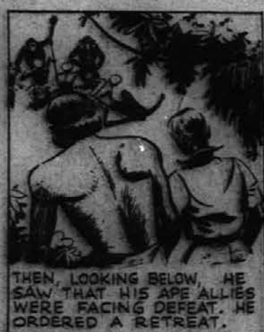
THEN, LOOKING BELOW, HE SAW THAT HIS APE ALLIES WERE FACING DEFEAT. HE ORDERED A RETREAT.