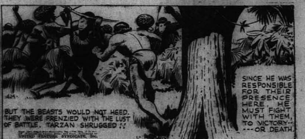
BUT THE BEASTS WOULD NOT HEED. THEY WERE PREZIED WITH THE LUST OF BATTLE. TARZAN SHRUGGED!!

SINCE HE WAS RESPONSIBLE FOR THEIR PRESENCE HERE, HE MUST FIGHT WITH THEM, TO VICTORY, OR DEATH.