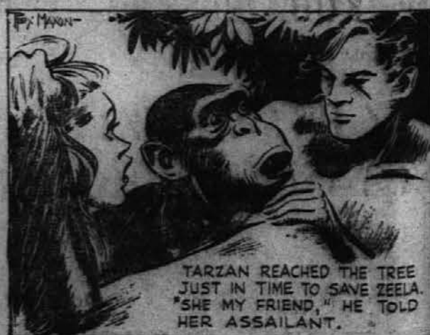
TARZAN REACHED THE TREE JUST IN TIME TO SAVE ZELLA. "SHE MY FRIEND," HE TOLD HER ASSAILANT.