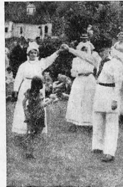
Belokranjsko velikonočno kolo

Številke v oklepajih ti dajo ključ za črke v imenih vasi. Kaj ti te črke po vrsti povedo?