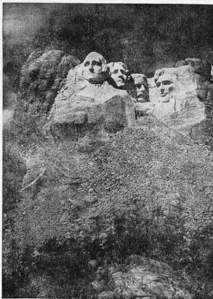
Eden največjih spomenikov nekdanjim predsednikom Združenih držav je nedvomno Mount Rushmore v južni Dakoti, v severozapadnem delu ZDA. V višini okrog tri tisoč metrov so vklesani v vrhove gore doprsni kipi Jurija Washingtona, Tomaža Jeffersona, Teodora Roosevelta in Abrahama Lincolna (od leve proti desni). V granit izklesani kipi presegajo za 465 krat naravno velikost in so visoki preko dvesto metrov. Načrte je izdelal znani ameriški kipar Gutzon Borglum in dela tudi vodil od 1. 1927. do 1. 1941., ko je umrl. Delo dokončuje sedaj njegov sin Lincoln Borglum.

Vse vlade, ki so podpisale atlantsko pogodbo, so ameriško vlado uradno zaprosile za pomoč v denarju in orožju. Ameriška vlada je prošnje sprejela in bo predložila kongresu, naj zaprošeno pomoč odobri. To je izjavil ameriški zunanji minister Acheson, ki je rekel, da ni mogoče misliti na obnovo zahodne Evrope, če se države in posamezniki ne bodo počutili varne.