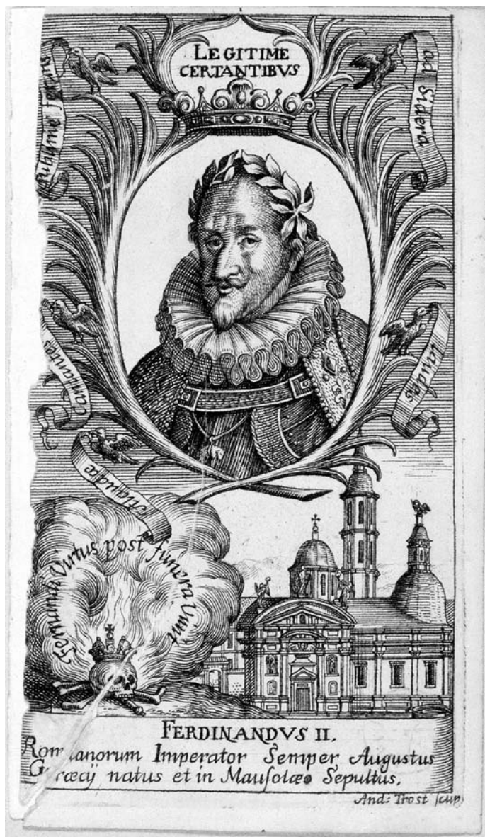
Anonimni avtor, Cesar Ferdinand II. (NMS, Grafični kabinet, inv. št. G-596,)

zu, ki je za svoje podložnike odgovoren kot oče za svoje otroke, vendar poleg očetovske srčnosti in miline premore tudi ostrino in od svojih podložnikov terja brezpogojno poslušnost. Kot meje svoje oblasti je priznaval deželno ustavo ter krščansko etiko po katoliškem nauku. S sakralizirano patriarhalnim političnim imaginarijem je bila imanentno povezana tudi skrb deželnega kneza za »pravovernost« njegovih podložnikov po nauku »edino zveličavne« katoliške Cerkve. 24 V ta kontekst želimo postaviti Ferdinandov patent z dne 12. novembra 1599, ki je vzorčni primerek iz vrste njegovih protireformacijskih ukrepov s časa na prelomu iz 16. v 17. stoletje, dekret pa je gotovo eden glavnih znanilcev konca protestantizma med meščani in kmeti v deželi.