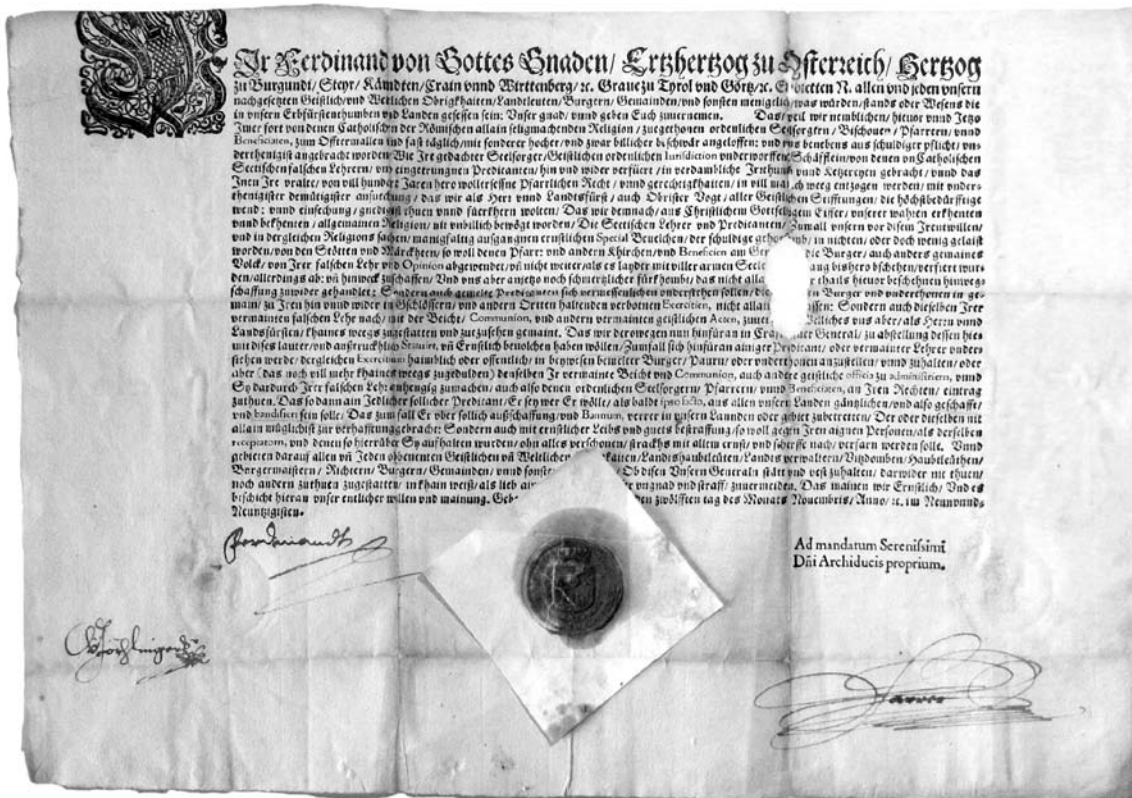
Patent Gradec, 12. november 1599 (ARS, AS 1, fasc. 135, šk. 261, lit. R, XIV/9)