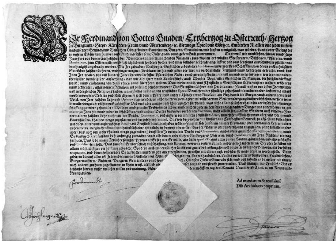
Patent, Gradec, 12. november 1599 (ARS, AS 1097, mapa 2, Cesarski patenti 1560–1619, št. 92)