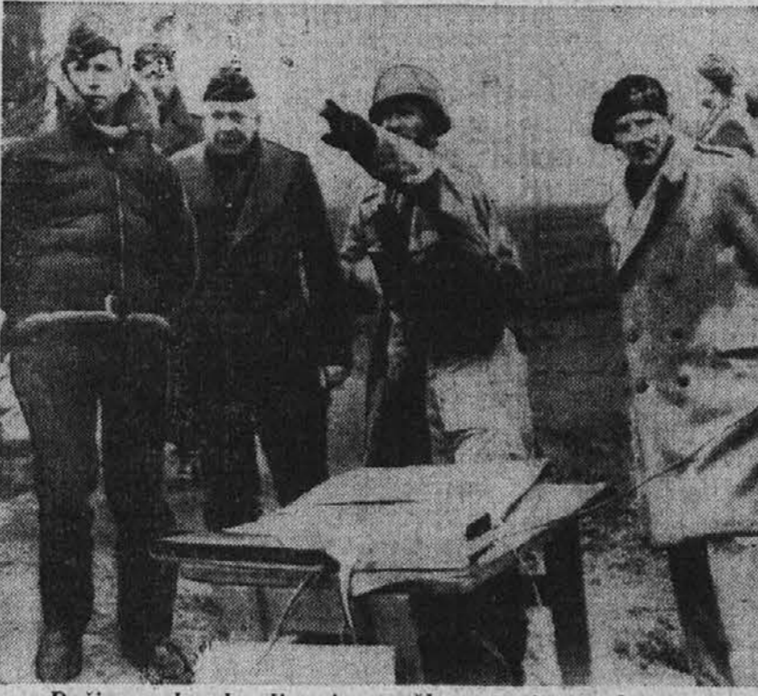
Dočim se bombardiranje nemškega in francoskega obrežja nadaljuje brez prestanka podnevi in ponoči, se s pripravami za invazijo nadaljuje v istem tempu. Slika predstavlja letalskega maršala Sir Arthur Tedder, na levi, gen. Dwight D. Eisenhowerja in gen. Montgomeryja na skrajni desni strani, ko opazujejo manuvre na angleškem obrežju.