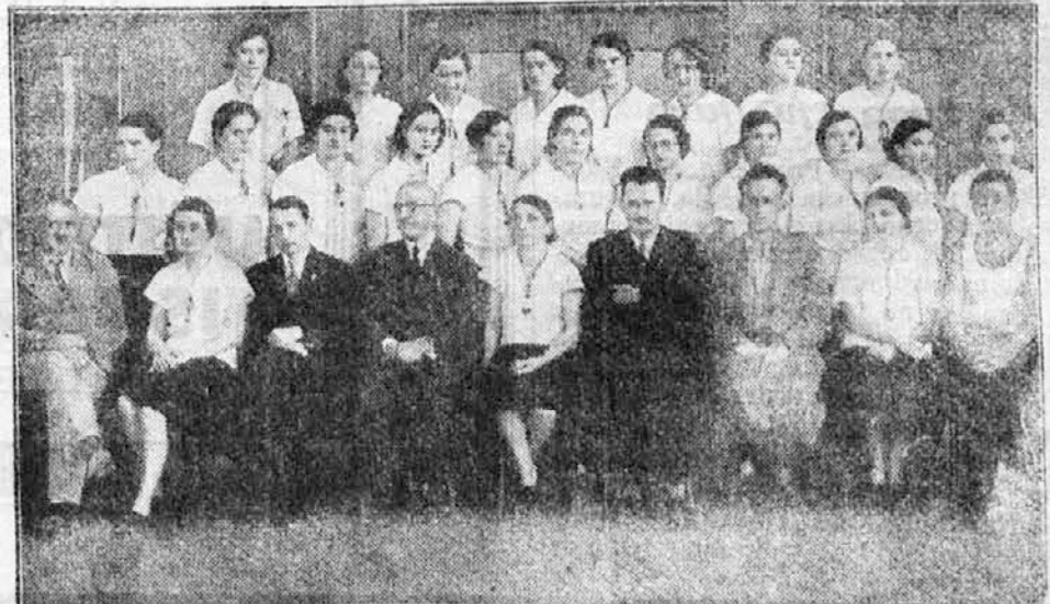
Župski prednjački tečaj za članice u Karlovcu od 18—31 marta o. g.