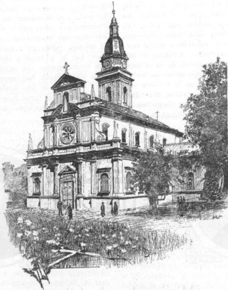
Romarska cerkev na Brezjah.

Nesreče po katoliških misijonih. Iz Srednje Afrike poročajo o hudi lakoti, ki traja že osemnajst mesecev. Po potih leži polno mrličev, za katere se pulijo zveri. Mnogo