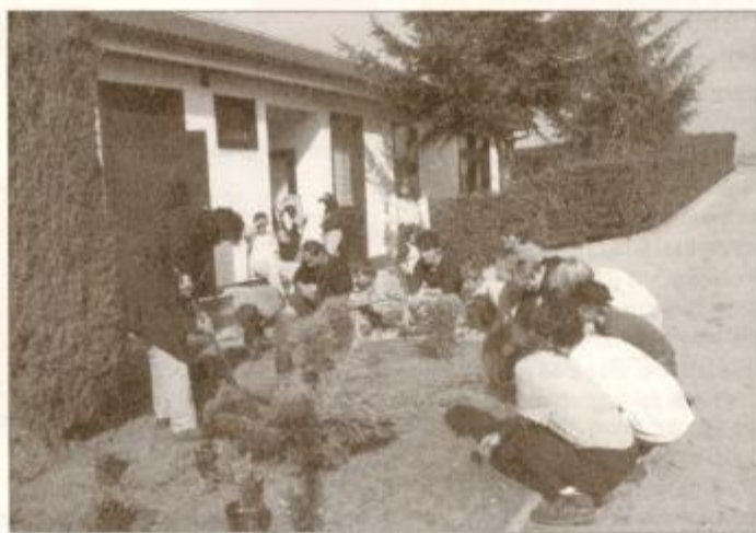
Otroci so pazljivo prisluhnili navodilom in potem grmičke zasadili tudi sami.

so si privoščili še malo družabnosti. Zabavali so se ob izvedbi karaok, zelo sivoesno je bilo ob zasedanju šolskega parlamenta, imeli so celo gasilsko vajo. Najbolj pa so se otroci razveselili obiska svojih prijateljev iz Ljutomera, s katerimi so si že nekaj časa dopisovali. Pripravili so jim kulturni program in pogostitev, razkazali so jim šolo in kraj. Za zaključek so se sprehodili do gostilne Prosnik, kjer so si privoščili sok in sladice. Po poti pa so spoznali, da je za vozičkarje v Ormožu zelo težko, saj je nemalo arhitektonskih ovir in premalo primerno urejenih prehodov. Ravnatelj Lesjak je za konec povedal, da se želijo čimveč pojavljati v javnosti, v kraju, saj so se predolgo zapirali med svoje štiri stene. Določeno število otrok je bilo in vedno bo drugačnih, s posebnimi potrebami in nekoliko manjšimi zmožnostmi od večine. Takšni otroci si želijo razumevanje svoje okolice in ne pomilovanje.