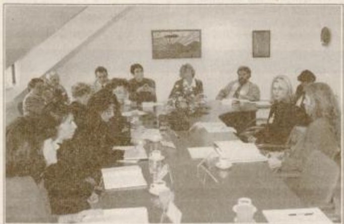
Udeleženci okrogle mize so ugotavljali, da se epidemija drog naglo širi

Ta konec tedna je na Ptuj bil dvodnevna druga konferenca slovenskih lokalnih akcijskih skupin za preprečevanje zlorabe drog, ki so jo organizirali projektni svet Ptuj - zdravo mesto in lokalna akcijska skupina za preprečevanje odvisnosti Ptuj ter FIRIS Imperl & Co. - razvojni inženiring socialnega varstva Logatec.