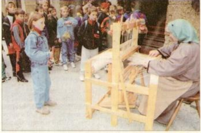
Na srednjeveški tržnici, ki jo je obiskalo največ mladih obiskovalcev, se je predstavilo osemnajst starih obrti.