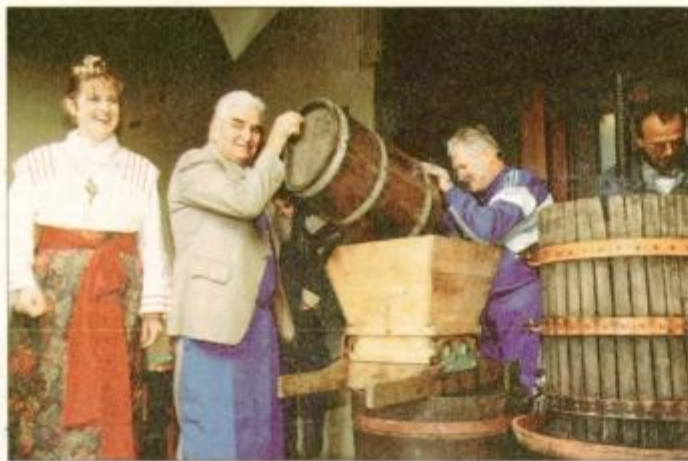
Stiskanje je bilo kar uspešno, 105 kg grozdja je dalo 72 litrov mošta.