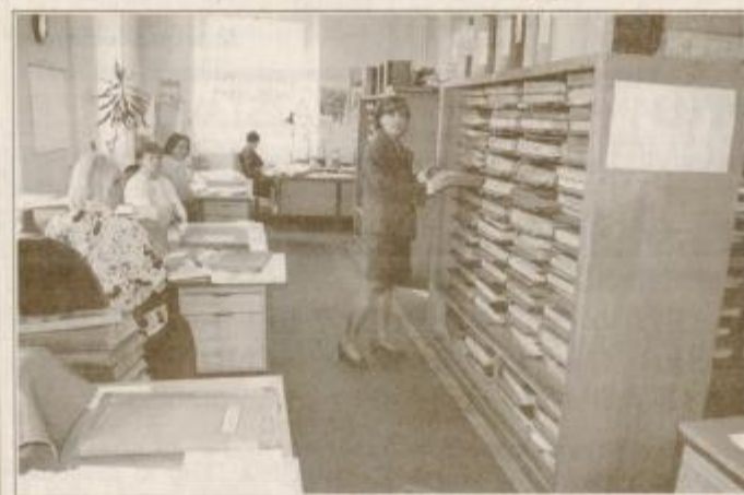
Na zemljiški knjigi jih skrbi zaradi kadrovske in prostorske stiske

še vedno vpisane travnike in njive. Zaradi tega je še veliko zadev nedodelanih in nedorečenih. Navsezadnje je problematično tudi vprašanje, kdo bo sedaj poravnal stroške, ki v zvezi s tem nastajajo. Po zakonu bi jih moral poravnati investitor, če tega ni storil, pa ima stranka pravico vložiti zahtevek za vpis in ji pripada tudi pravica do povrnitve teh stroškov. Sedaj je tudi z zakonom določeno, da mora investitor gradnje stavbe, katerih posamezni deli so namenjeni za prodajo, v 60 dneh od izdaje dokončnega uporabnega dovoljenja