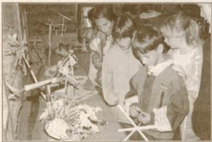
Gorišniški otroci so v Dominkovi domačiji pripravili razstavo izdelkov iz ličja in koruze

ZAVRČ / PLAZ OB REGIONALNI SANIRAN ŠE TA TEDEN