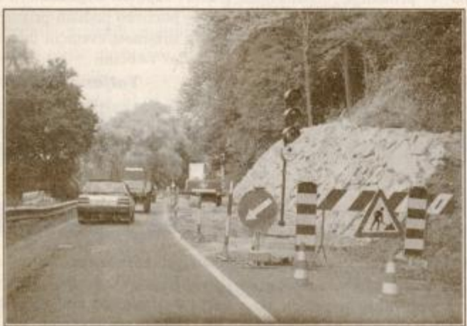
Plaz ob regionalni cesti Moškanjci - Zavrč je saniran in s tem so odpravljene težave za voznike.

Že dober mesec delavci Podjetja za urejanje hudournikov iz Ljubljane sanirajo plaz ob regionalni cesti R 347 v smeri mejnega prehoda Zavrč. Sanacijska dela so v teh dneh v zaključni fazi, saj naj bi sredi tega tedna izvajalec uredil nabrežine ob cesti.