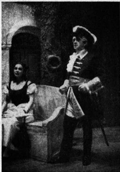
Kot Lescant v Massenetovi »Manon«