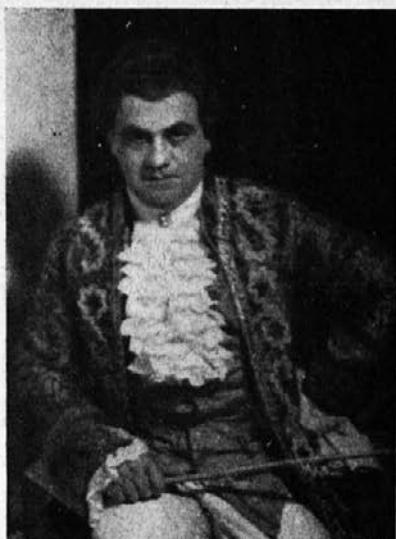
»Figarova svatba« (grof Almaviva)