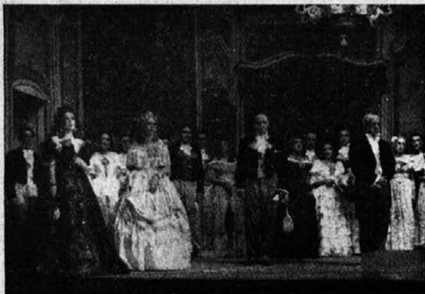
»Traviata« (3. dejanje)

Moj ideal je bil vedno — veliko gledališče, ki bi imelo mnogo sedežev in nizko vstopnino. Prav v tistih letih je vladala gledališka kriza skoraj po vsem svetu. Glej čudo! V Rušah so krizo odpravili na mah! Preprost pohorski drvar, žagar in kmet je imel do gledališča različne predsodke in ravno to vrsto publike bi si bil rad pridobil. Letnemu gledališču se je plaho približal, stal pod smreko v bližini in nezaupno opazoval tok dogajanj na sceni. Pri teh ljudeh za vstopnino nismo bili natančni. Drugo leto je že pogumno pristopil k blagajni in plačal vstopnino, s seboj pa je privedel ženo in najbližje znanke. Tretje leto pa je komaj dočakal nove igre. Tako se je rekrutirala naša publika. Uprizarjali smo samo ljudske igre s petjem in primitivno glasbo, črpali pa smo repertoar samo iz jugoslovanske literature. Kostume smo si izposojevali pri mariborskem, ljubljanskem in celo zagrebškem gledališču. Igralci so za narodne, oziroma kmečke igre naravnost nenadkriljivi. Mnogokrat tujci nikakor niso hoteli verjeti, da so to zgolj diletanti. Iz vstopnine smo si potem nabavljali cement za zidavo novih teras in kupovali nove kostume in narodne noše, ki smo jih imeli že krasno zbirko.