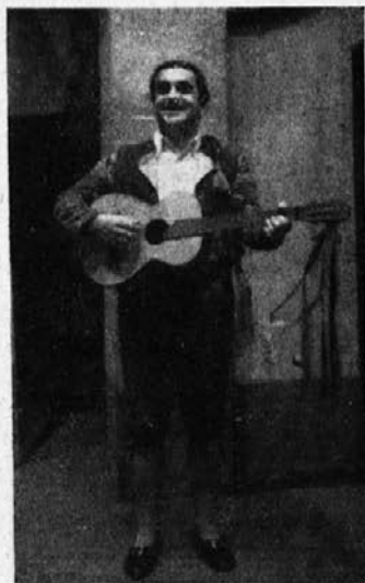
Figaro v »Seviljskem brivcu«