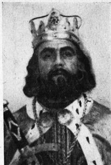
»Car Kalojan« (car)