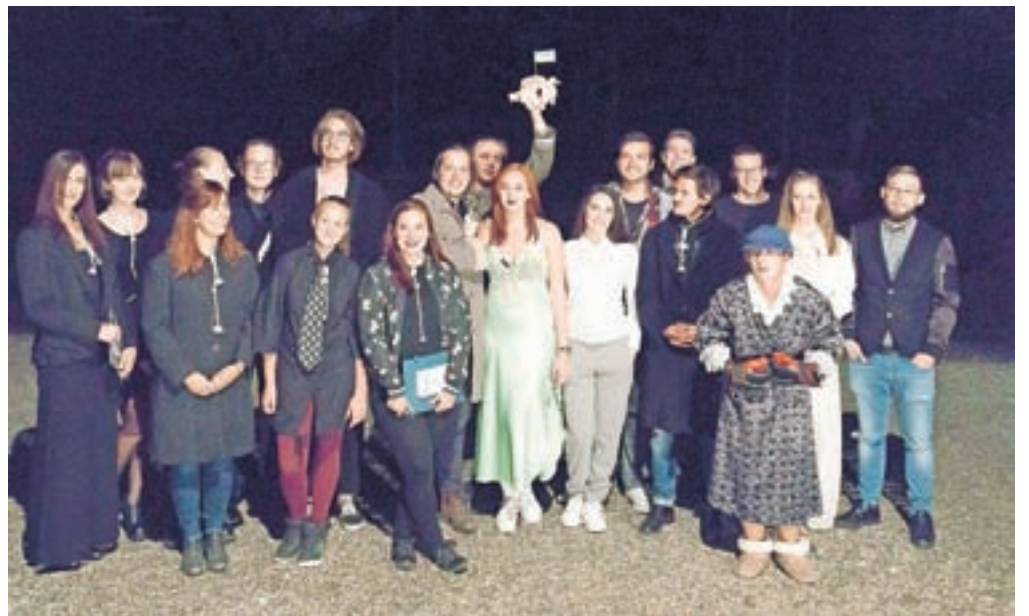
Vsi sodelujoči v performansu Zagonetni voz

Člani dramsko-umetniške skupine Oksimoron so se Kamničanom morda še zadnjič v Katzenbergu predstavili z razstavo uprizoritvenih del. Mladi umetniki, ki se že nekaj časa družijo v skupini Oksimoron, kar pomeni bistroumni nesmisel, so na zanimiv način obiskovalcem v šestih prizorih, v šestih prostorih, s šestimi režiserji predstavili svoje videnje manipulativnega sveta. Obiskovalci, razdeljeni v pet skupin, so bili na koncu v resnici zmanipulirani ne le v posameznih zgodbah, temveč tudi v dogajanju, saj je vsaka skupina doživela le štiri uprizoritve. Nastopajoči so se na gledalce obrnili z mislijo o drugačnih idejah, isti