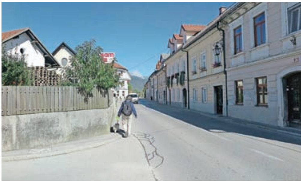
Občani se po središču mesta radi sprehajajo, a pločniki – kot tale na Medvedovi – pešcem še zdaleč niso povsod prijazni.

V pilotnem projektu smo s pomočjo projektne skupine, ki jo sestavljajo Kamničanke in Kamničani, oblikovali za-