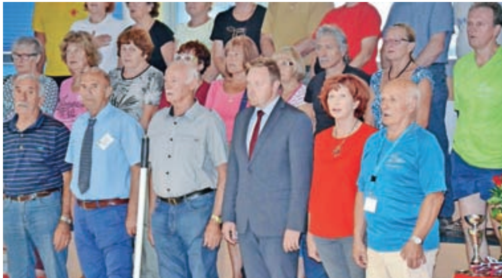
Odprtja državnih iger v kegljanju so se udeležili tudi povabljeni gostje.