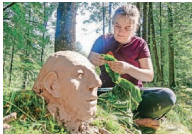
Izdelki iz gline so zaradi dežja večinoma že razpadli, tisti iz vej pa se bodo ohranili še nekaj tednov.

dež, zato so svoje stvaritve obiskovalcem predstavili le na slikah, v naravi pa bodo na ogled, dokler ne bodo razpadli.