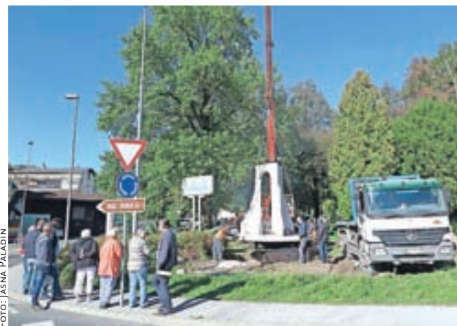
Kapelico so začeli postavljati v petek, 28. septembra.