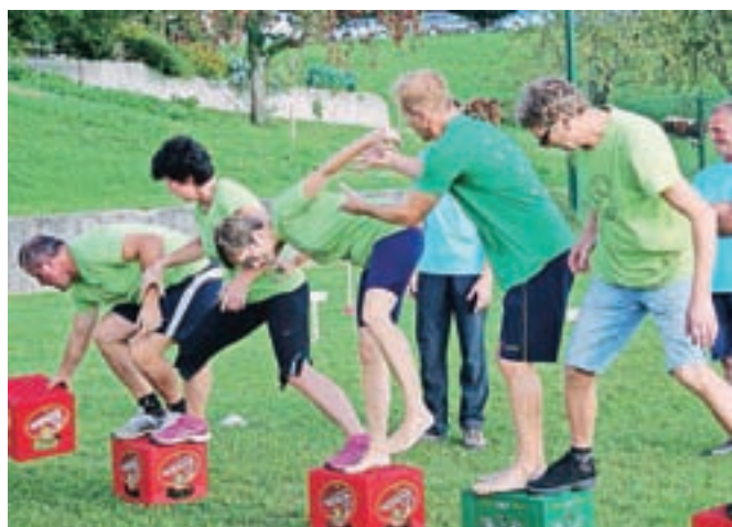
Letos se je v dvanajstih igrah, ki si vsebinsko ne bi mogle biti bolj različne, pomerilo šest ekip.