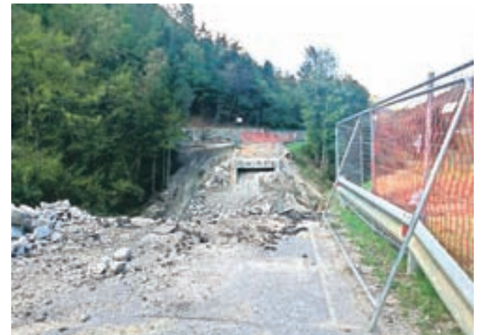
Dela v Črni bodo predvidoma končana v prvi polovici prihodnjega leta, država pa bo zanje namenila 1,3 milijona evrov.

kot tudi priključne ceste do obeh mostov. Celotna dolžina posega je približno 350 metrov, pogodbeni vrednost del pa je dobrih 1,3 milijona evrov. Dela bodo predvidoma dokončana v prvi polovici leta 2019. Obvozno cesto bodo po dokončanju del odstranili oz. vzpostavili v prvotno stanje.