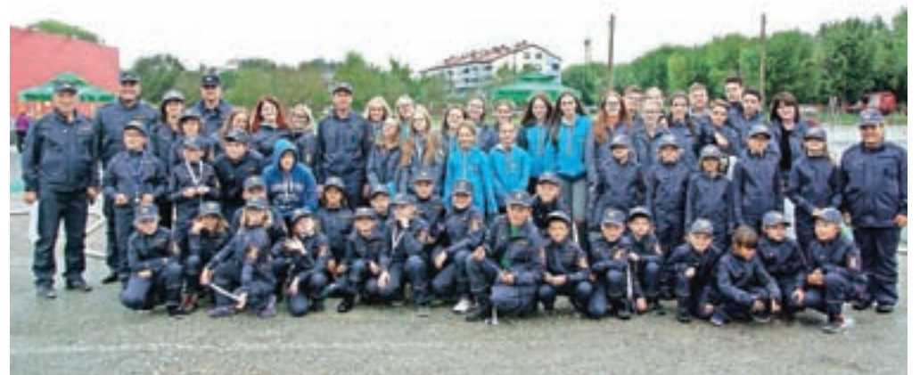
Skupinska fotografija udeležencev tekmovanja iz Gasilske zveze Kamnik

Kamnik – Državno gasilsko tekmovanje za memorial Matevža Haceta so v soboto in nedeljo, 22. in 23. septembra, gostili v Gornji Radgoni. V soboto je bilo najprej tekmovanje za mladino, v nedeljo pa za člane in starejše gasilce. Med mladinskimi ekipami se je s svojimi vrstniki iz vse države pomerilo pet tekmovalnih enot iz Gasilske zveze Kamnik, in sicer pionirke PGD Špitalič in PGD Srednja vas, pionirji PGD Srednja vas, mladinke PGD Zgornji Tuhinj in mladinci PGD Šmarca. Pionirji so se pomerili v vaji z vedrovko, štafeti s preno-