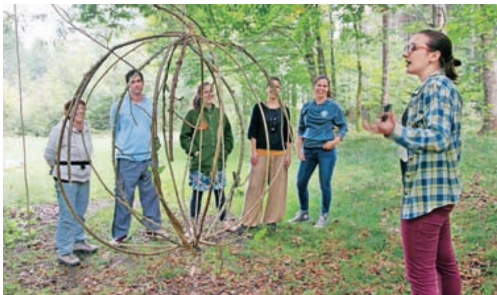
Umetniki so ustvarjali zgolj iz materialov, ki so jih našli na mestu samem.

»Čeprav je to moj prvi tvorstveni projekt, me nabiralništvo in ustvarjanje v naravi iz narave spremlja že dlje časa. Gre za nekakšen naravni instinkt po oblikovanju snovi, ki je okoli mene. Sodelujoči so ustvarjali individualno, vsak si je našel svoj prostor in tam začel graditi svoje avtorsko delo, ki je bilo vezano na prostor v smislu, da ni prenosljivo. Uporabili smo lahko zgolj materiale, ki smo jih našli na mestu samem, a izbira je bila velika – vse od šibja, vejevja, kamnov, proda do zemlje, zelenega rastlinja, mahov in gline. Glino smo nakopali nekaj dni prej,