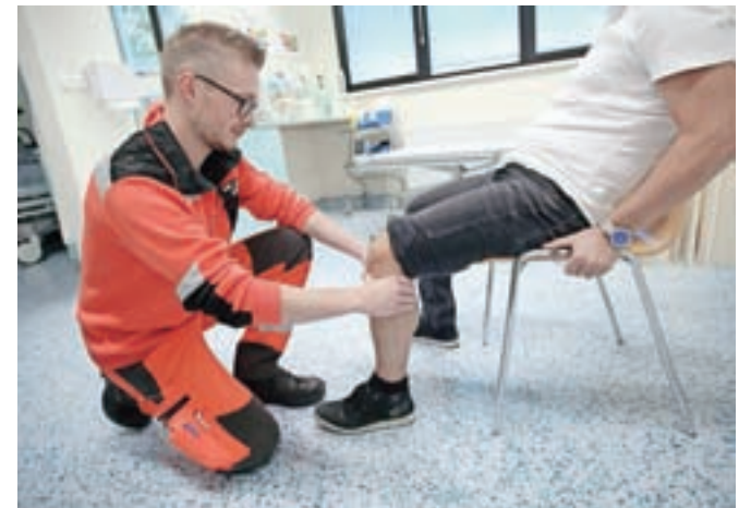
Urgenca ima zdaj pet ambulantnih prostorov, vključno s prostorom za reanimacijo, operacijsko ambulanto za male kirurške posege in opazovalnico.

evrov), tako da imajo pacientke Zdravstvenega doma Kamnik na voljo zdaj dve. Okrepljene so tudi družinske ambulante; že lani so pridobili en nov tim, letos pa še enega. Prav te dni pričakujejo še enega novega družinskega zdravnika. Zelijo si, da bi se pacienti lahko nekoliko prerazporedili,