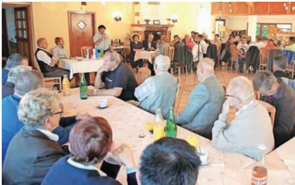
Srečanja z ministrico se je udeležilo več kot sto občanov.