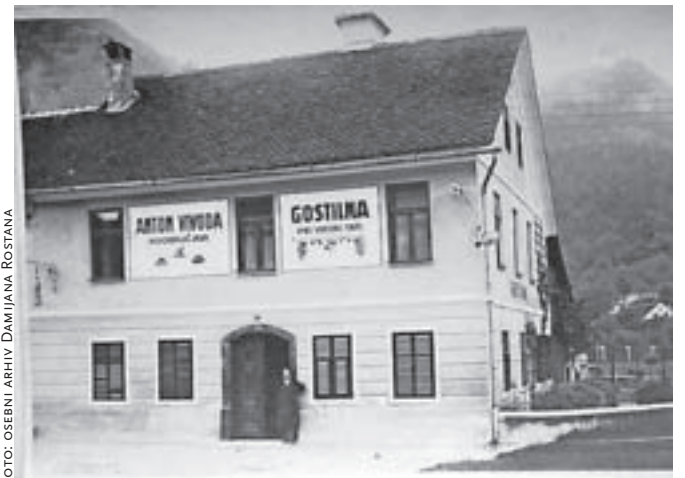
Gostilna Pri vinski trti na današnji Parmovi ulici je bila nekdanj priljubljeno zbirališče umetnikov in kulturnikov, ki so povečini sicer spali v gradu Zaprice. Hiša je še danes praktično nespremenjena, le gostilne že dolgo ni več.