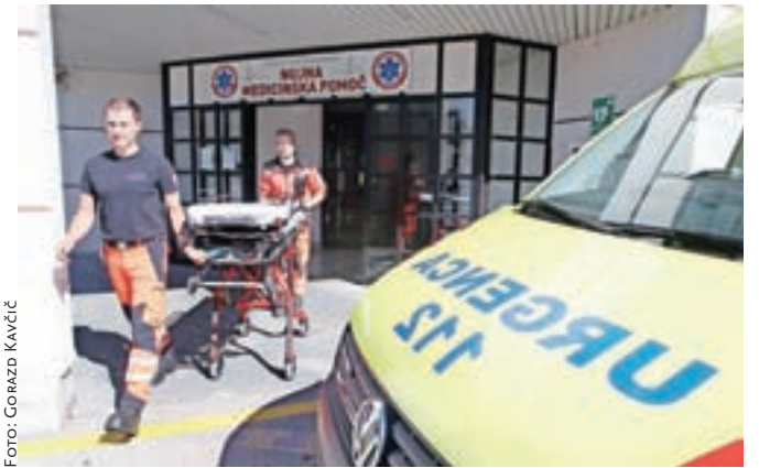
Kamniška urgenca je po prenovi še bolj dostopna pacientom, prijaznejša pa je tudi zaposlenim.

Povsem nova je ginekološka ambulanta (vrednost investicije je okoli 60 tisoč