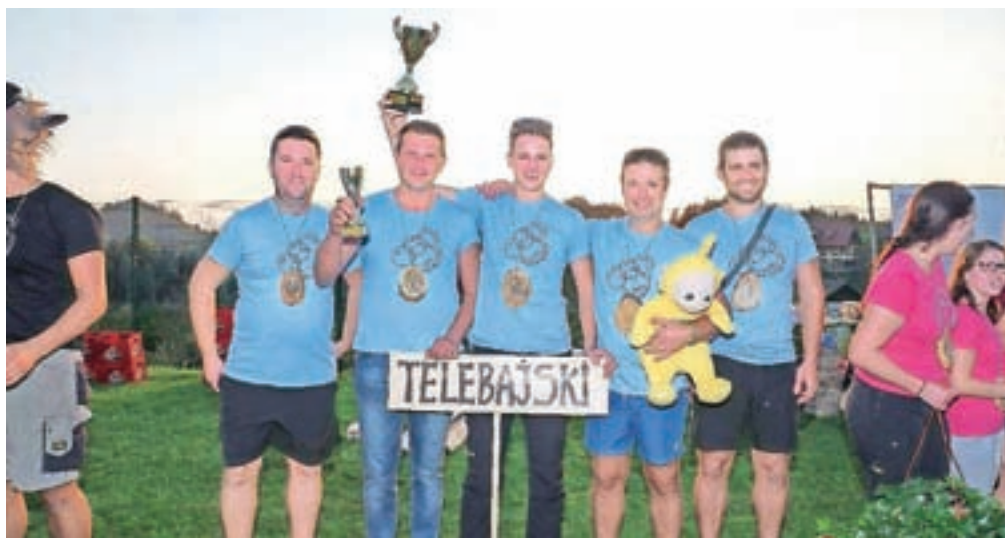
Zmagovalka letošnjih Iger brez meja v Tunjicah je bila ekipa Telebajski.

njostjo raje spodbujali krepitev medsebojnih odnosov in složnega sodelovanja, ki bodo pomembni predvsem za prihodnost. Ekipa Žabci, Packi, Telebajski, Bršljanke, Zlatorogi in Zad'n rob so se zato namesto tradicionalnega merjenja moči, spretnosti in hitrosti v skupinskem ekipnem tekmovanju, ki je na podlagi točkovanja določilo končen vrstni red, letos prvič pomerili v sklopu nalog, ki sta jih naključno krojila tudi kanček sreče in usoda. Organizatorji dogodka so namreč igre priredili po znani igri Človek ne jezi se, le da so bila tekmovalna polja tokrat večja, prav tako figure, ki so jih kapetani ekip premikali po poljih. Končni razplet pa je krojil met kocke ter seveda uspešno opravljene naloge v posameznem sklopu, ki so jih morali tekmovalci izžrebati glede na pozicijo svoje tekmovalne figure. Ekipa so naloge poskušale uspešno opraviti v treh različnih sklopih: individualnem, pri katerem so sodelovale posamično, sodelovalnem, pri katerem sta sodelovali dve naključno sestavljeni ekipi, ter tekmovalnem, v katerem se je med seboj za posamezno zmago pomerilo več ekip hkrati. Prav sklop sodelovalnih iger pa je bil tisti, ki je na letošnjih igrah navdušil. Za obojestransko napredovanje po