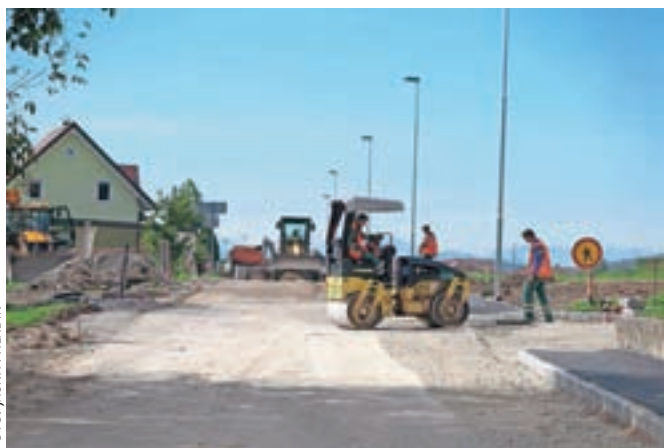
Obnova odseka ceste skozi Podgorje se bliža koncu.

Podgorje – Prometnih zastojev zaradi obnove ceste skozi Podgorje kmalu ne bo več, saj se dela bližajo koncu. Občina Kamnik namreč obvešča, da bo še danes in jutri, 5. in 6. oktobra, zaradi asfaltiranja veljala sprememba prometnega režima, in sicer popolna zapora lokalne ceste Podgorje-Kamnik. Obvoz bo v tem času urejen po Ljubljanski cesti in obvoznici. J. P.