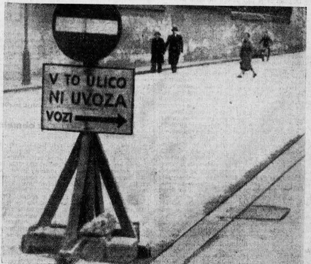
Na križišču Miklošičeve in Dalmatinove ulice...