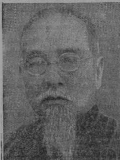
Kitajski predsednik Lin-Sen.

nje, če bo država podpirala razvoj telesne vzgoje, če jo vodi zasebna pobuda, je odgovoril g. minister: »Država se bo potrudila, da te zasebno pobudo podpre in jo vzdrži. V okviru proračunskih možnosti bo država tudi denarno podpirala zasebno pobudo.«