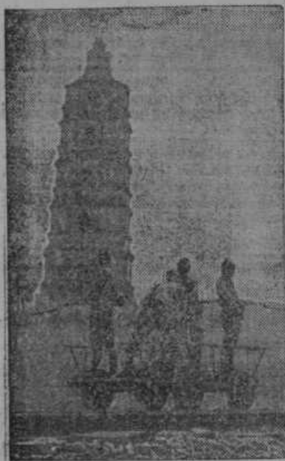
Na severnem kitajskem bojišču nadzirajo japonske patrulje železniško progo, katere so se polastile japonske čete.

Novije s kitajskega bojišča. Japonci so izvajali veliko zmago južno od Pekinga ob železniškem tiru Hankov—Tjencin. S to zmago so