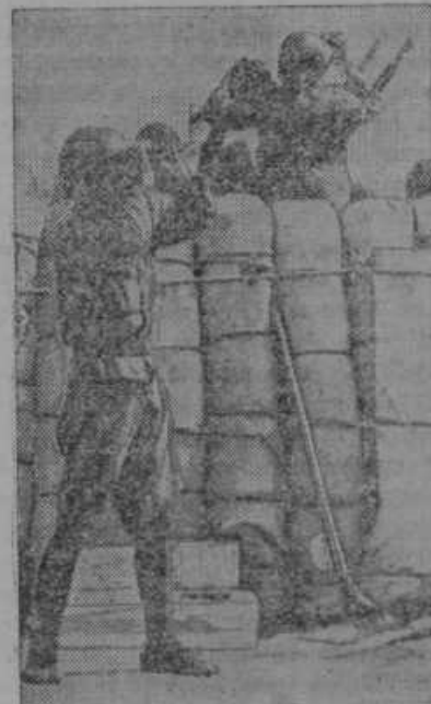
Japonski topnikar opazuje kitajske letalce.